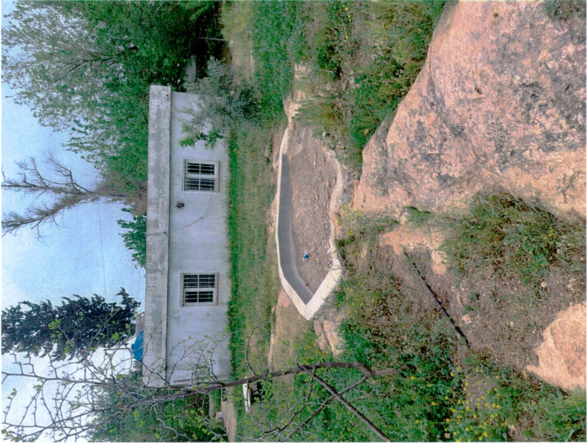
878 NOLU PARSELİN KUZUYİNDE BULUNAN BETONARME YAPININ GÜNEYİ VE KUZUYİNDEN GÖRÜNÜM

İLİ/İLÇESİ/MAH: ADANA/YÜREĞİR/CAMİLİ Mah. 878 parsel DOSYA NO : 01.14.578