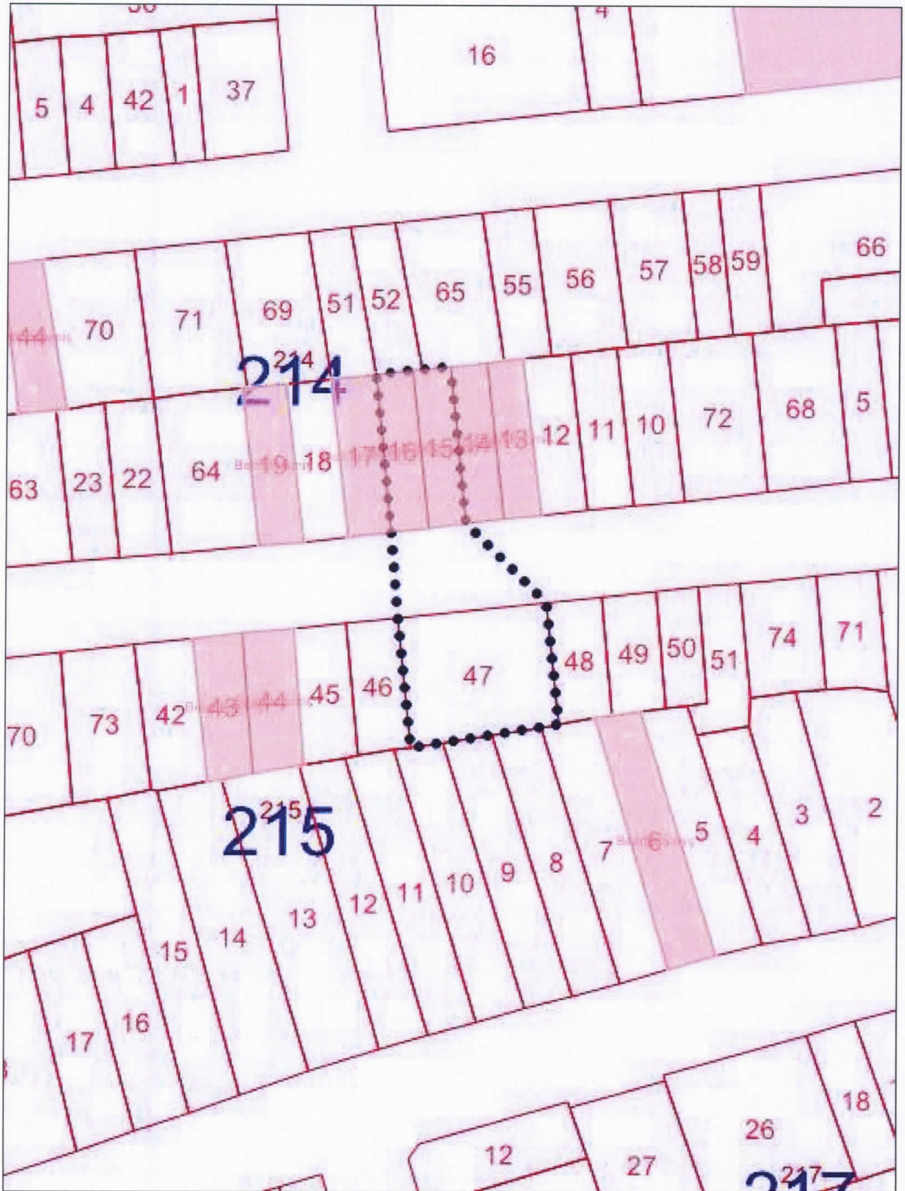
Kadıköy İlçesi, Rasimpaşa Mahallesi, 214 Ada, 15 ve 16 parsel Korunma Alanı