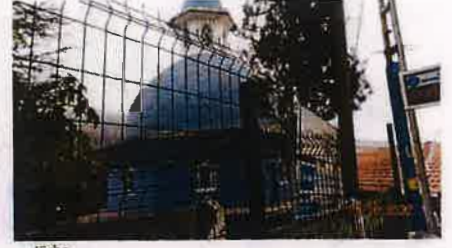
Günümüzde mezarların içinde bulunduğu eski türbe yıkılarak yerine yapılan betonarme türbe