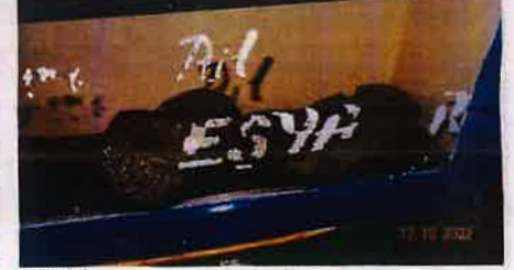
Günümüzdeki betonarme türbenin içinde yer alan köy halkı tarafından Şeyh Selaeddin Buhari ait olduğu söylenen eşyalar

Handwritten signature or text in blue ink, possibly a name or a date.