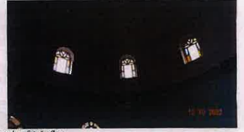
Günümüzde mezarların içinde bulunduğu eski türbe yıkılarak yerine yapılan betonarme türbenin iç mekân fotoğrafları