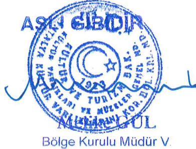
Bölge Kurulu Müdür V.

Antalya İli, Akseki İlçesi, Güzelsu Mahallesi, Mahmurtaş Mevkiinin batısında, Kurulumuzun 20.09.2018 tarih ve 8189 kararı ile “Korunması Gerekli Taşınmaz Kültür Varlığı olarak tescil edilen Antik Yapı Kalıntısının, koruma alanı sınırının belirlenmesi sırasında daha önce GPS ile alınmış koordinatların sapma oluşturması sebebi ile oluşan yanlışlıkların giderildiği kararımız eki 1/10000 ölçekli paftanın uygun bulunduğu (olumlu), Koruma alanı içerisinde 2863 sayılı yasanın 8. maddesi gereği Kurulumuzdan izinsiz herhangi bir inşai ve fiziki uygulamada bulunulmamasına, koruma alanı sınırının planlara işlenerek Kurulumuza iletilmesine, can ve mal güvenliğinin sağlanması amacıyla koruma alanında gerekli güvenlik önlemlerinin ilgili kurumlarca alınmasına karar verildi.