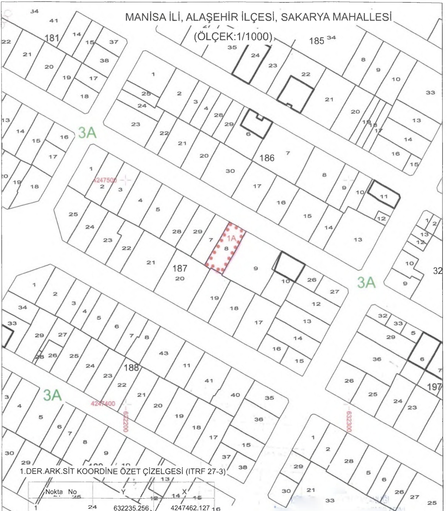
1.DER.ARK.SİT KOORDİNE ÖZET ÇİZELGESİ (ITRF 27-3)