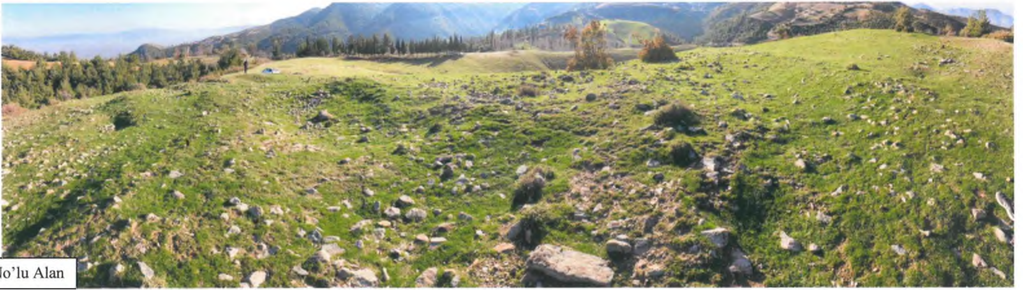
1 No'lu Alan