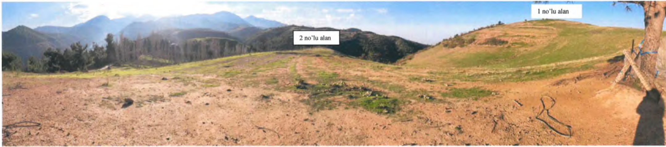
2 no'lu alan