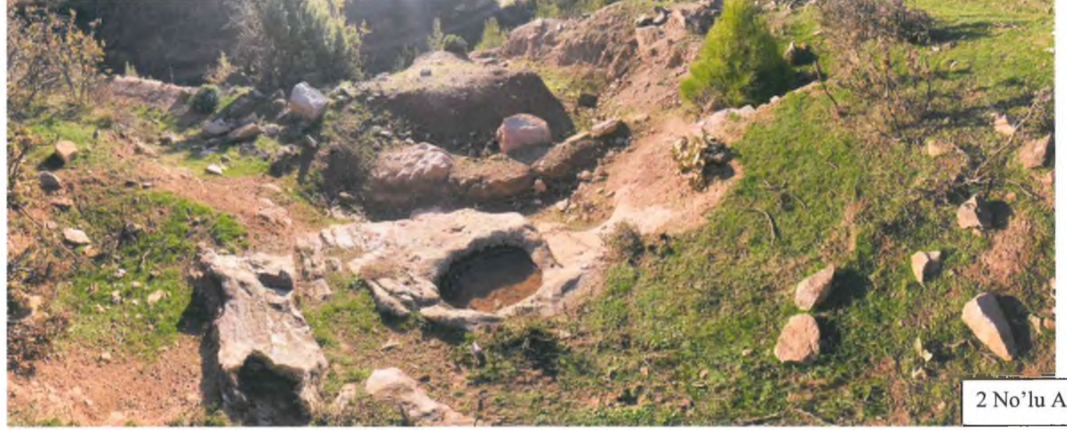
2 No'lu Alan