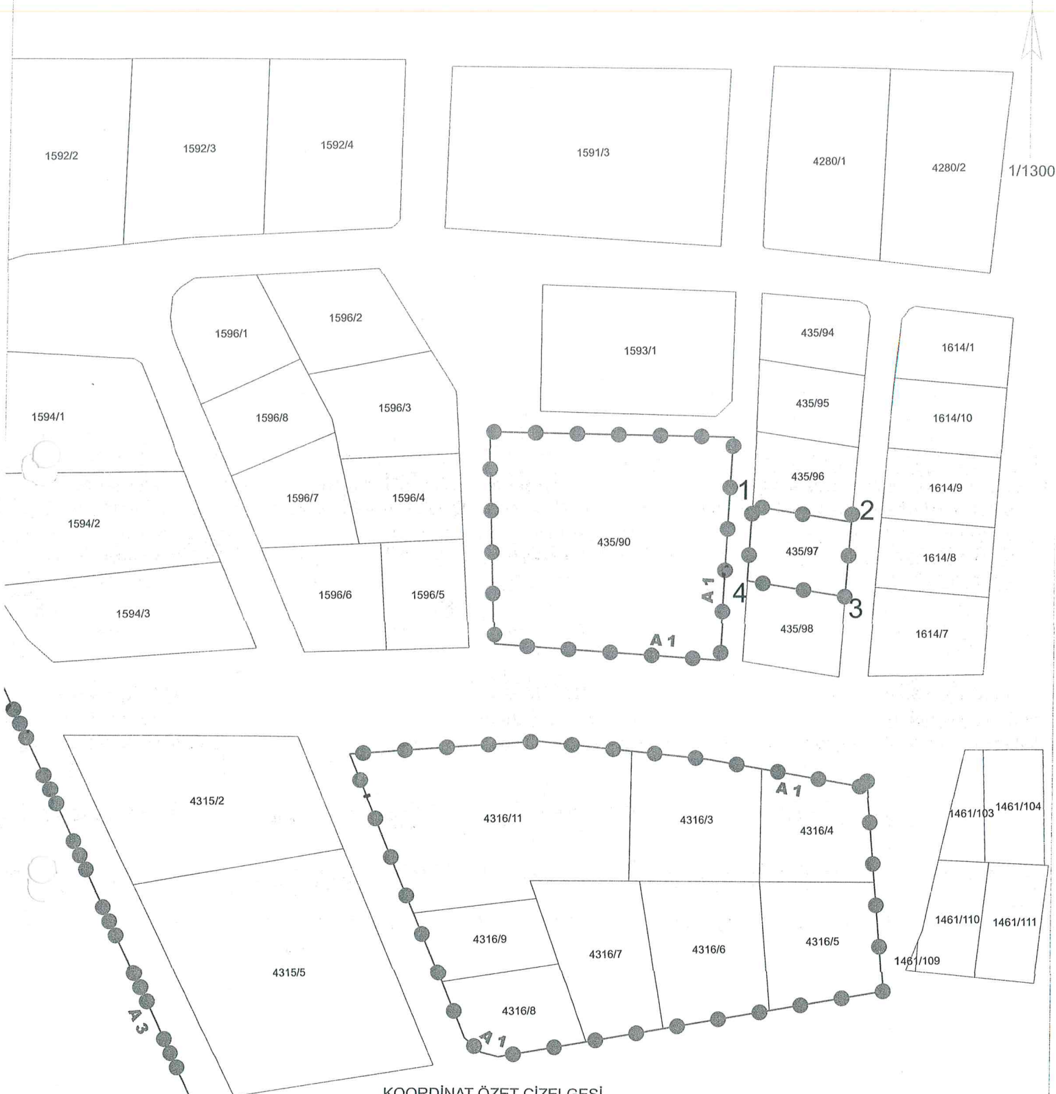
KOORDİNAT ÖZET ÇİZELGESİ UTM 3 ITRF 96