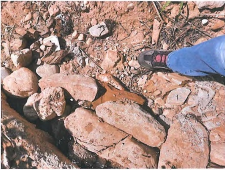
Arkeolojik buluntuların bulunduğu alandan görünümler

T.C. KÜLTÜR VE TURİZM BAKANLIĞI İzmir 2 Numaralı Kültür Varlıklarını Koruma Bölge Kurulu Müdürlüğü İZMİR 2 NUMARALI KÜLTÜR VARLIKLARINI KORUMA BÖLGE KURULUNUN 28.11.2023 TARİHLİ VE 19110 SAYILI KARARI EKİDİR.