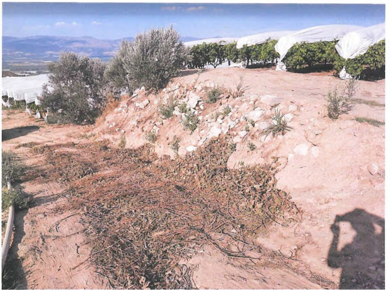
Arkeolojik buluntuların bulunduğu alandan görünüm

T.C. KÜLTÜR VE TURİZM BAKANLIĞI İzmir 2 Numaralı Kültür Varlıklarını Koruma Bölge Kurulu Müdürlüğü