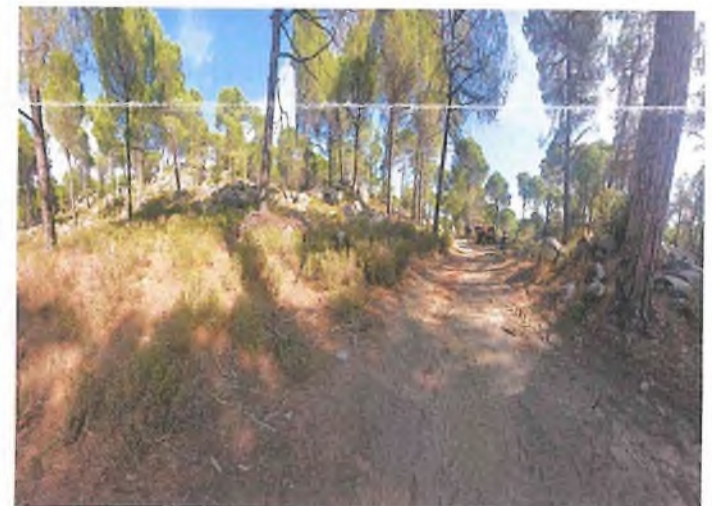
Alanın panoramik görünümü