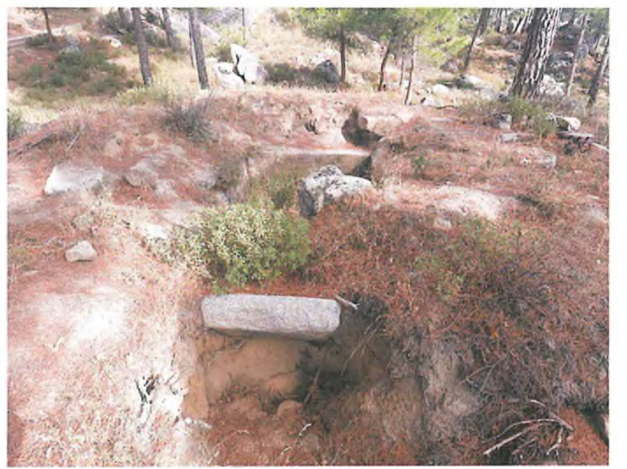
Mezar 2 (S2)