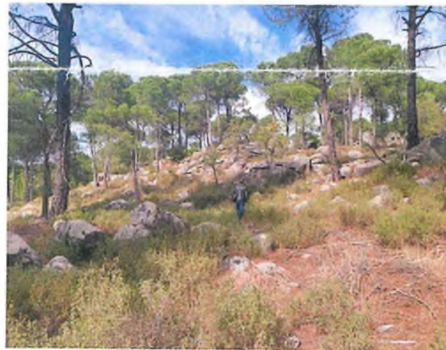
Mezar 2 (S2)