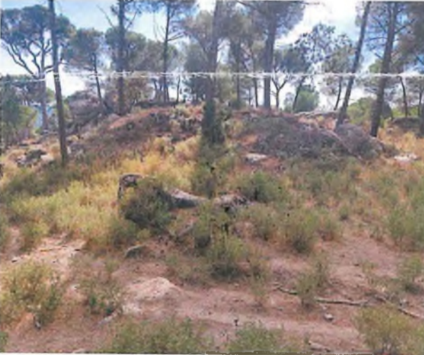
Mezar 1 (S1)