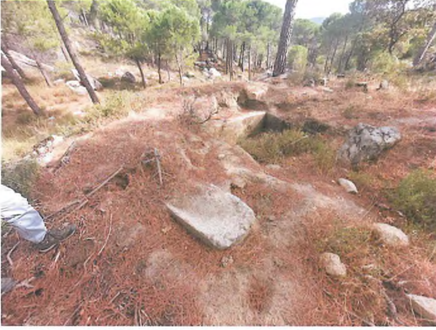
Mezar 1 (S1)