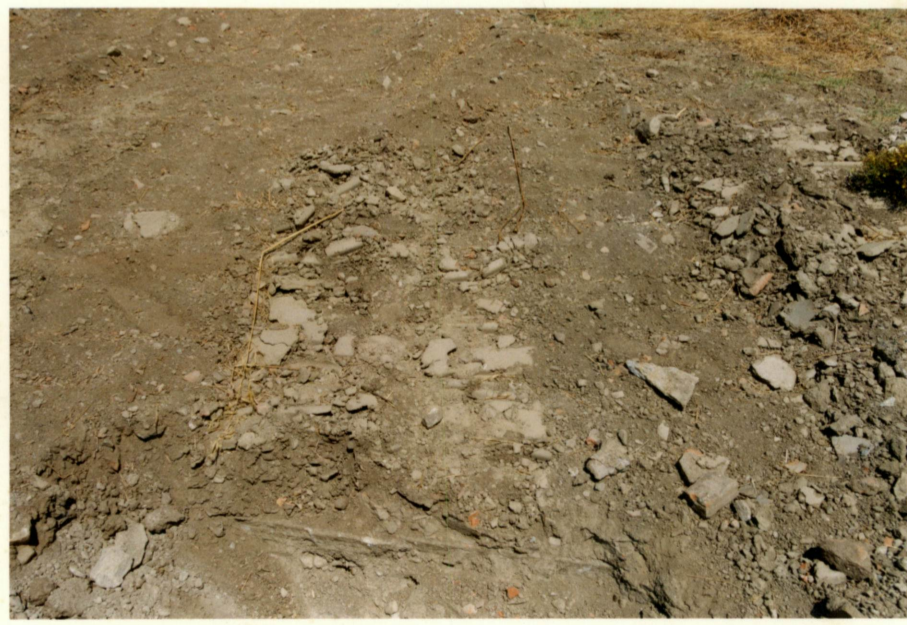
Palet izleri altında muhtemelen kopuk taş