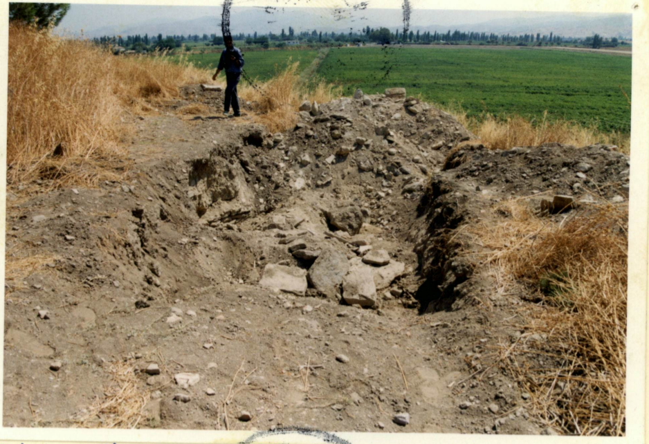
Tahrip edilen mezarın güneybatı görünüşü