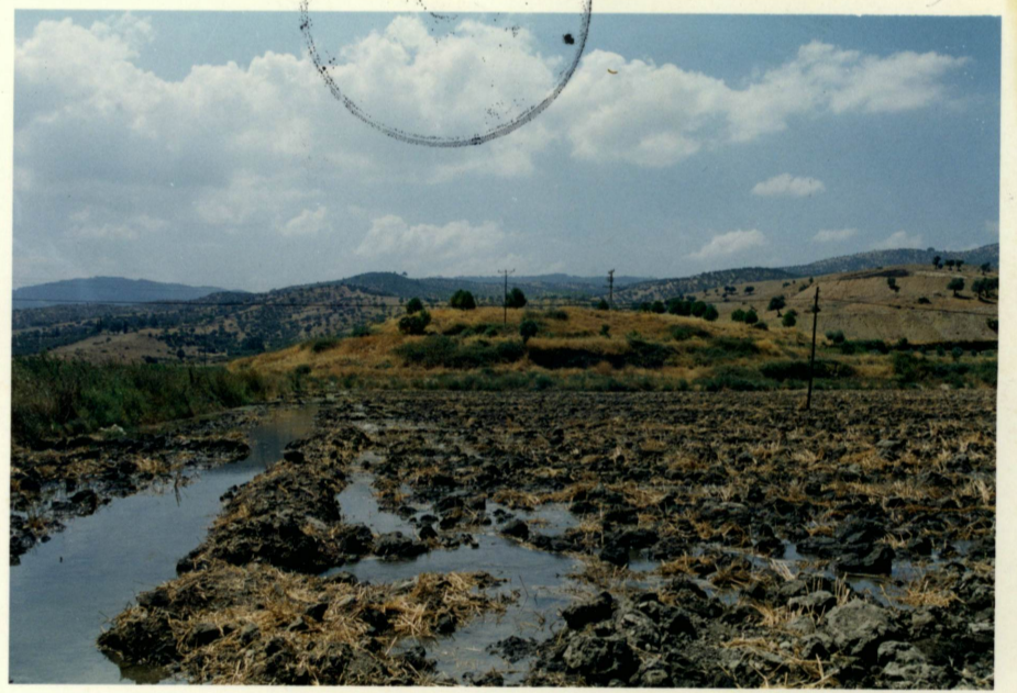
Kuzeyden genel görünüş