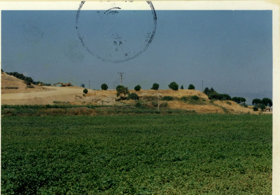
Doğudan tepe ve açılan yol ve saatiye