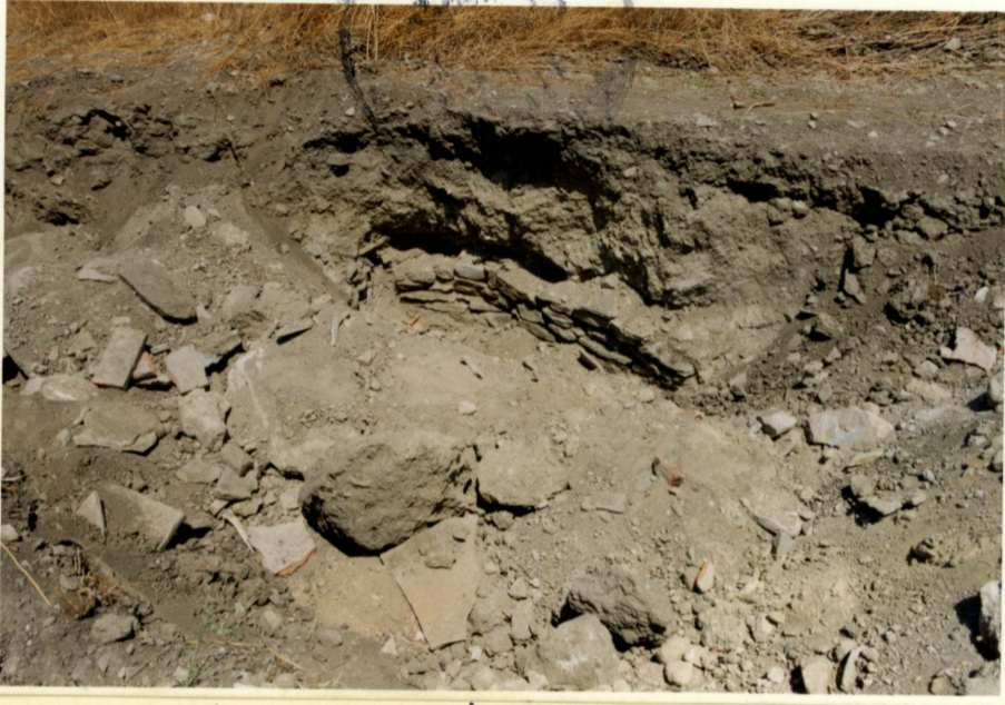
Mezarın güneyden görünüşü