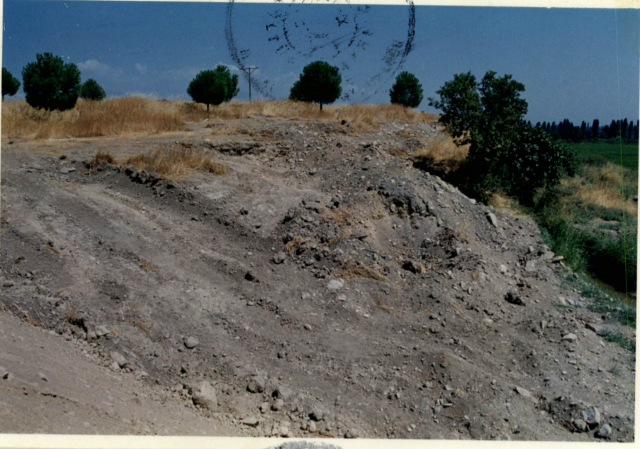
Güneyden kaçak kazı yapılan bölgenin görünüşü