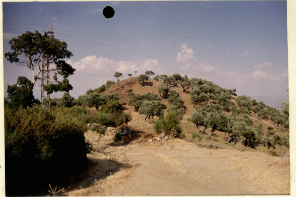
Çataltepe örenyeri genel görünüm