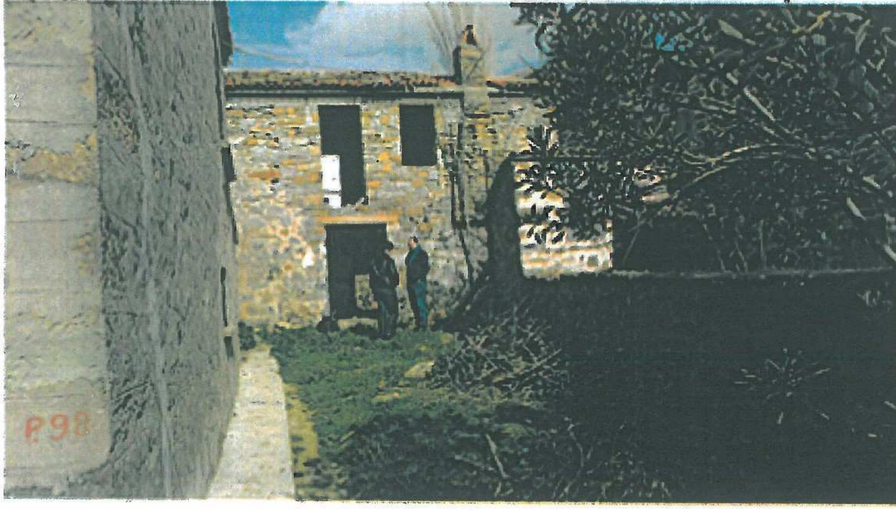
Parsel girişinden yapı ön cephesi