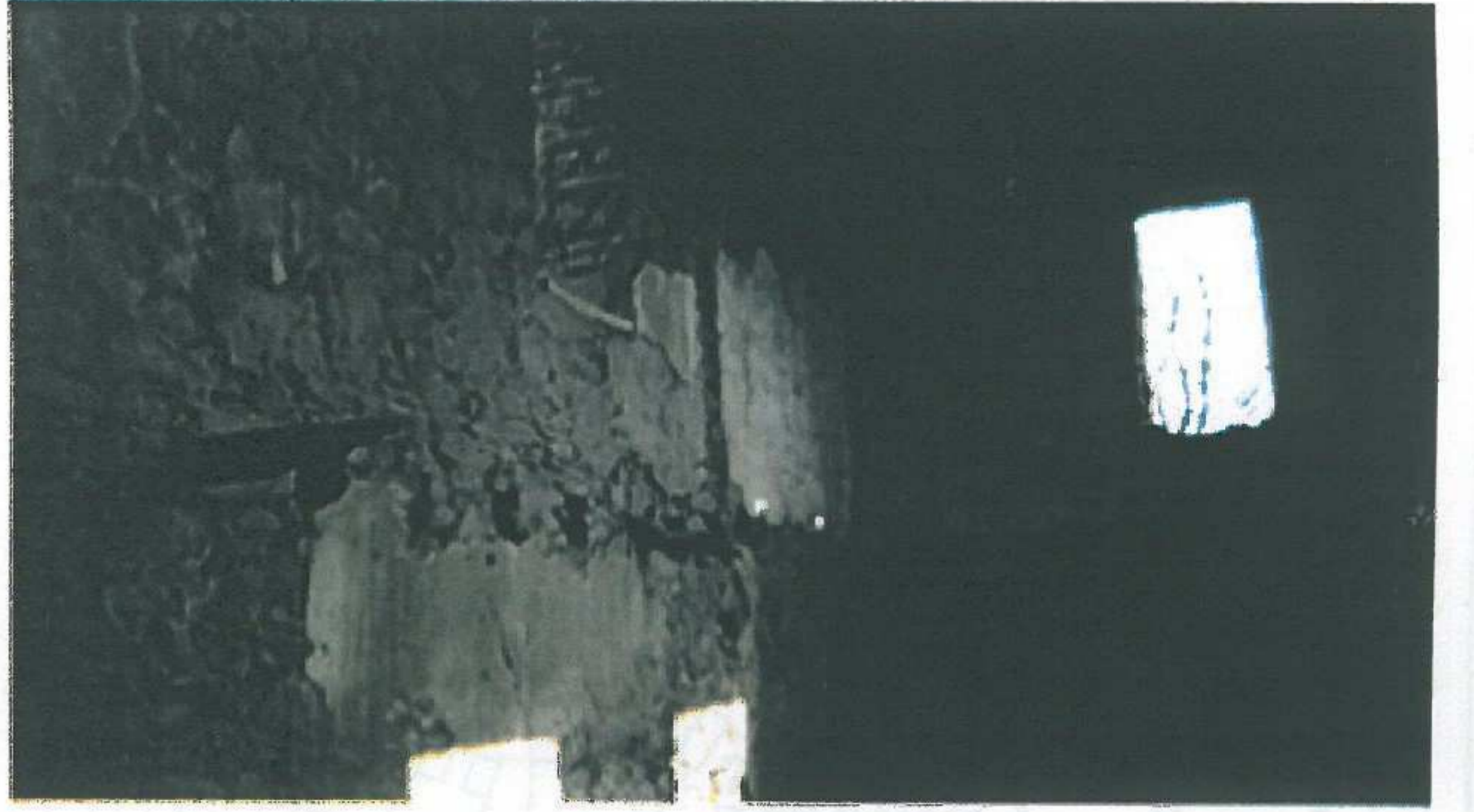
Ahşap kat döşemesi kirişleri