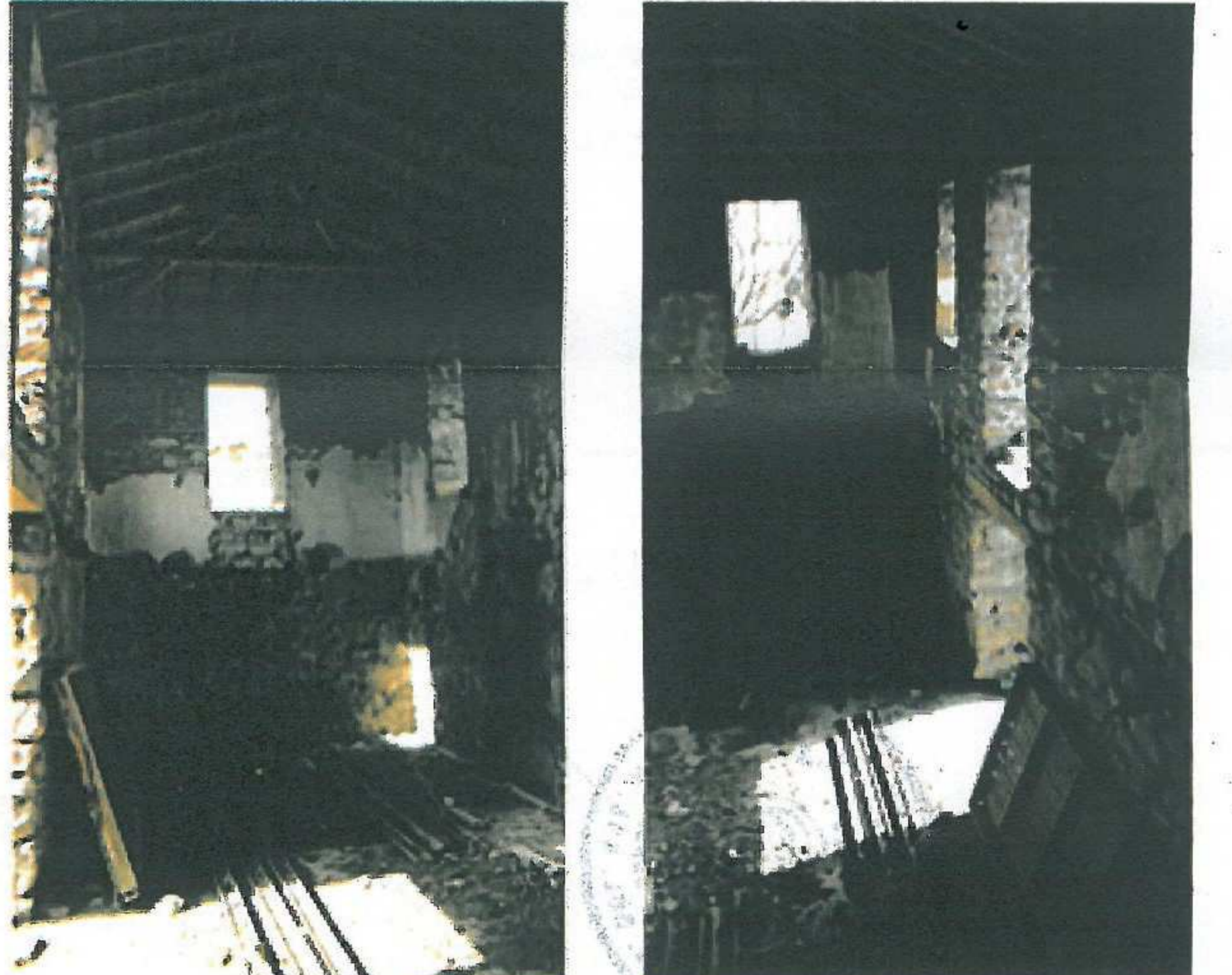
Yapı içinden detaylar