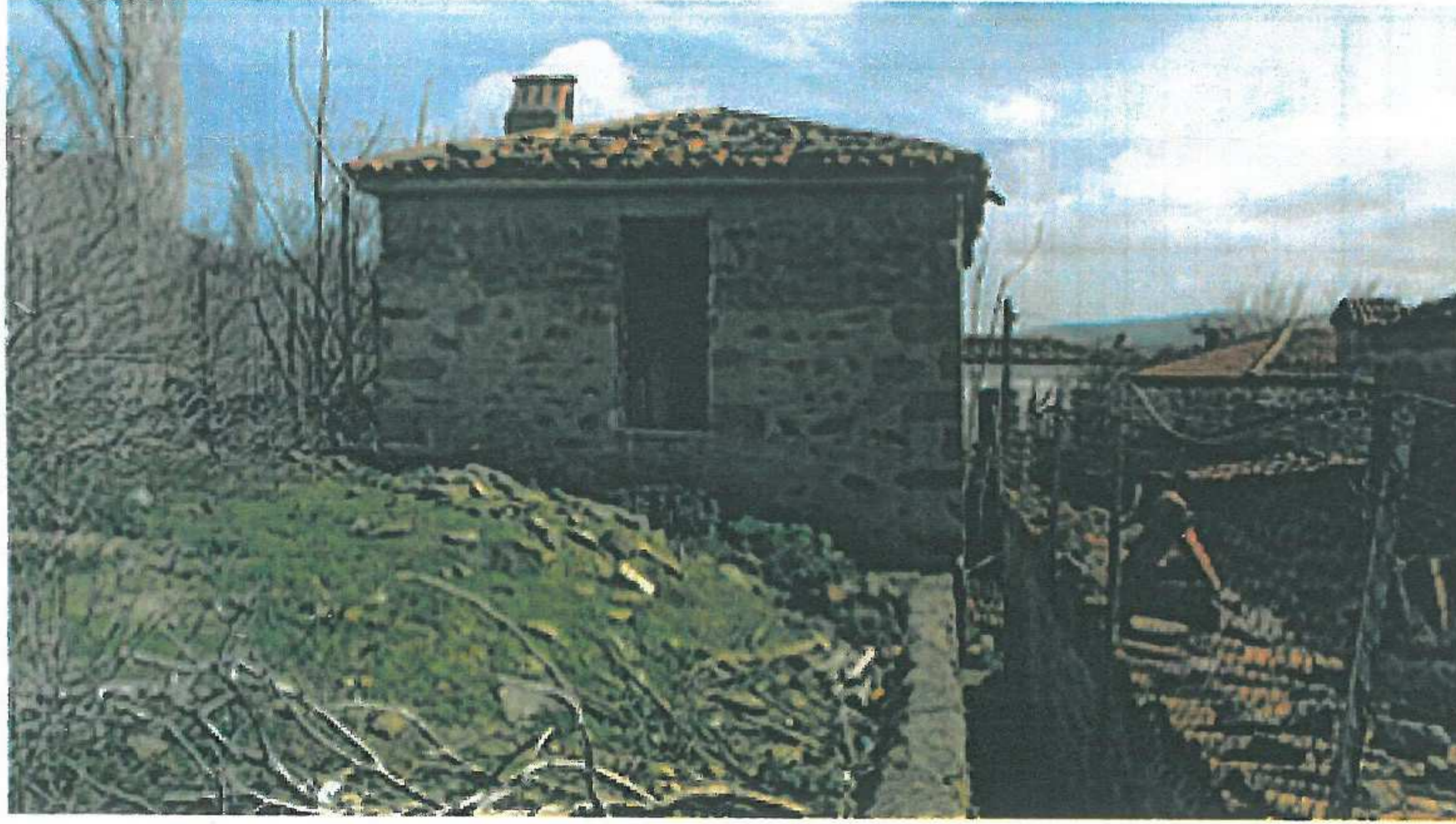
Sol yan cephe