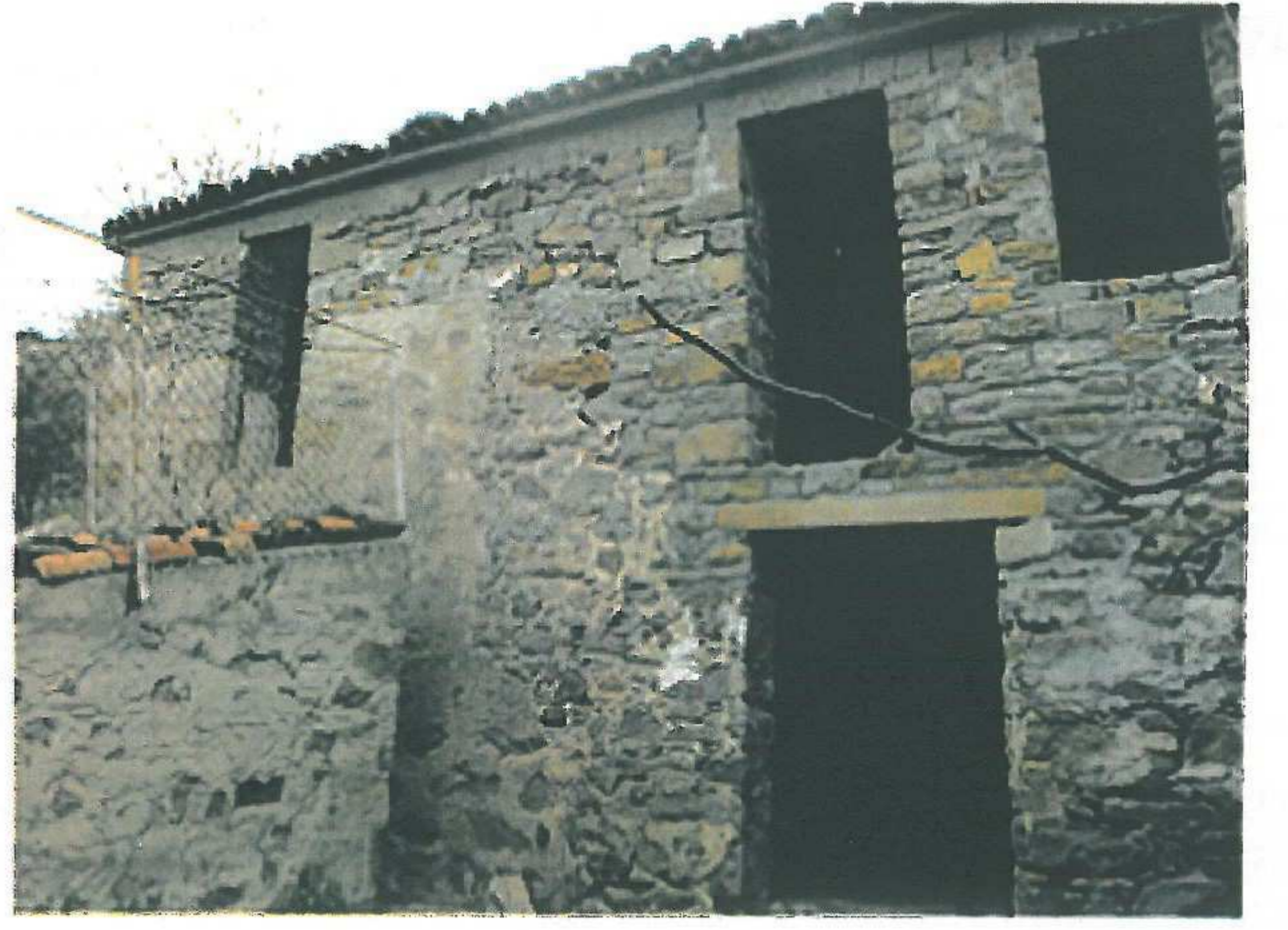
Yapı ön cephesi