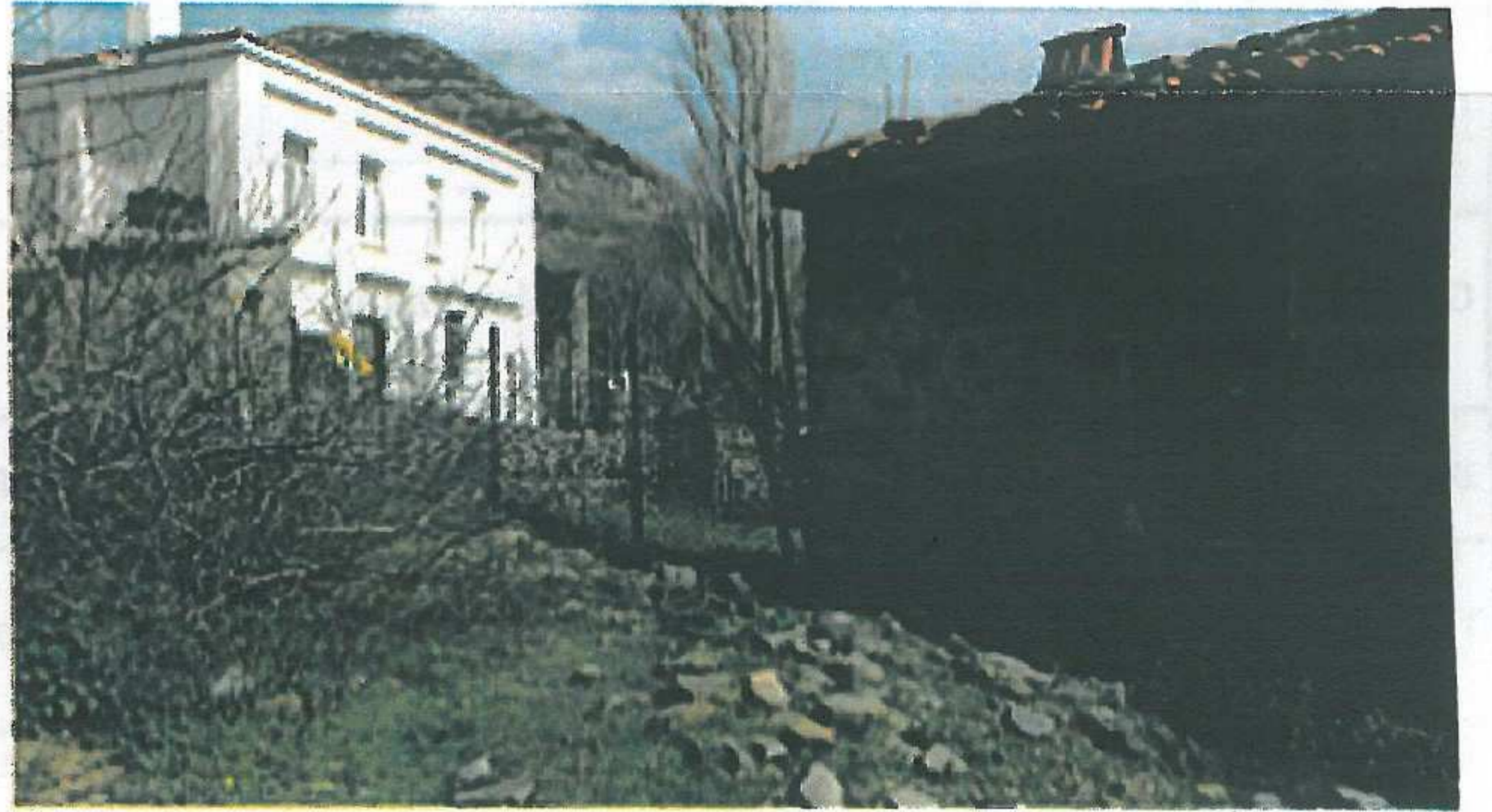
Sol yan cephe