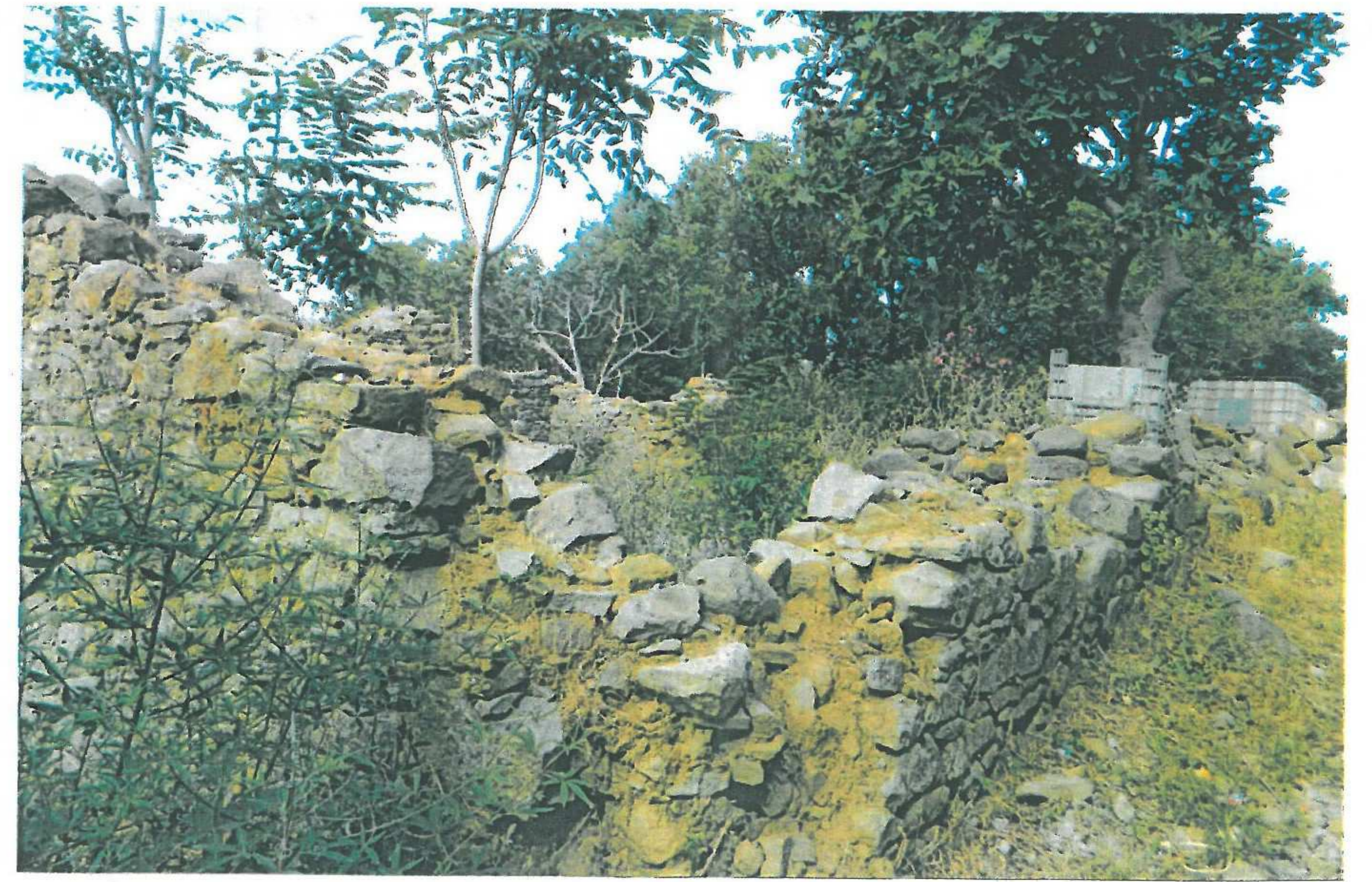
• Çanakkale İli, Gökçeada İlçesi, Eski Bademli Köyü Mevkii 128 ada 3 no'lu parsel.