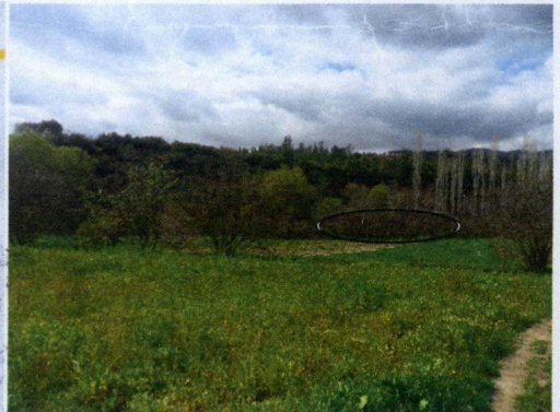
Resim 2: Alanı Gösteren Panoramik Görüntü