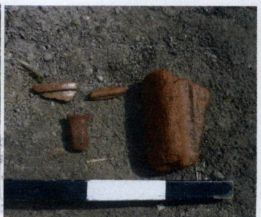
Resim 4: Yüzeyde Görülebilen Kültür Varlığı Örnekleri