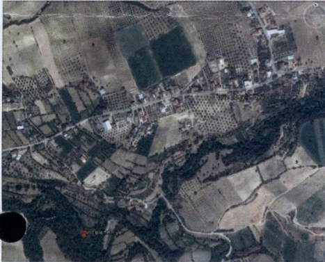
Resim 1: Yaklaşık Konumu Gösteren Uydur Görüntüsü