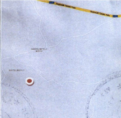
Resim 2: Yaklaşık Konumu Gösteren Uydur Haritası