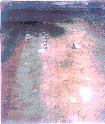
HARİTA - FOTOĞRAFLAR: J19-d2