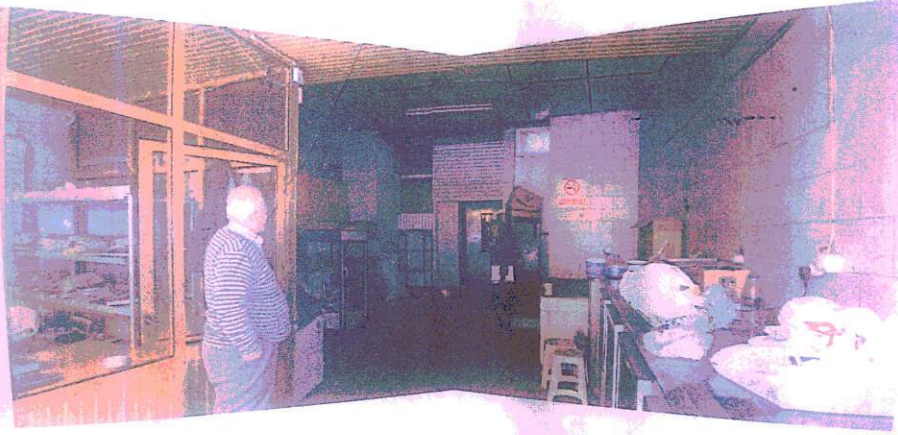
Ana binadan ek yapıya geçiş