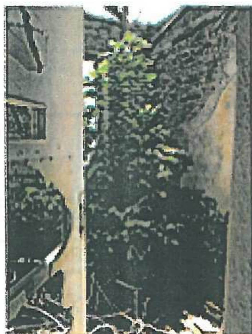
Girişin sağında Mekan