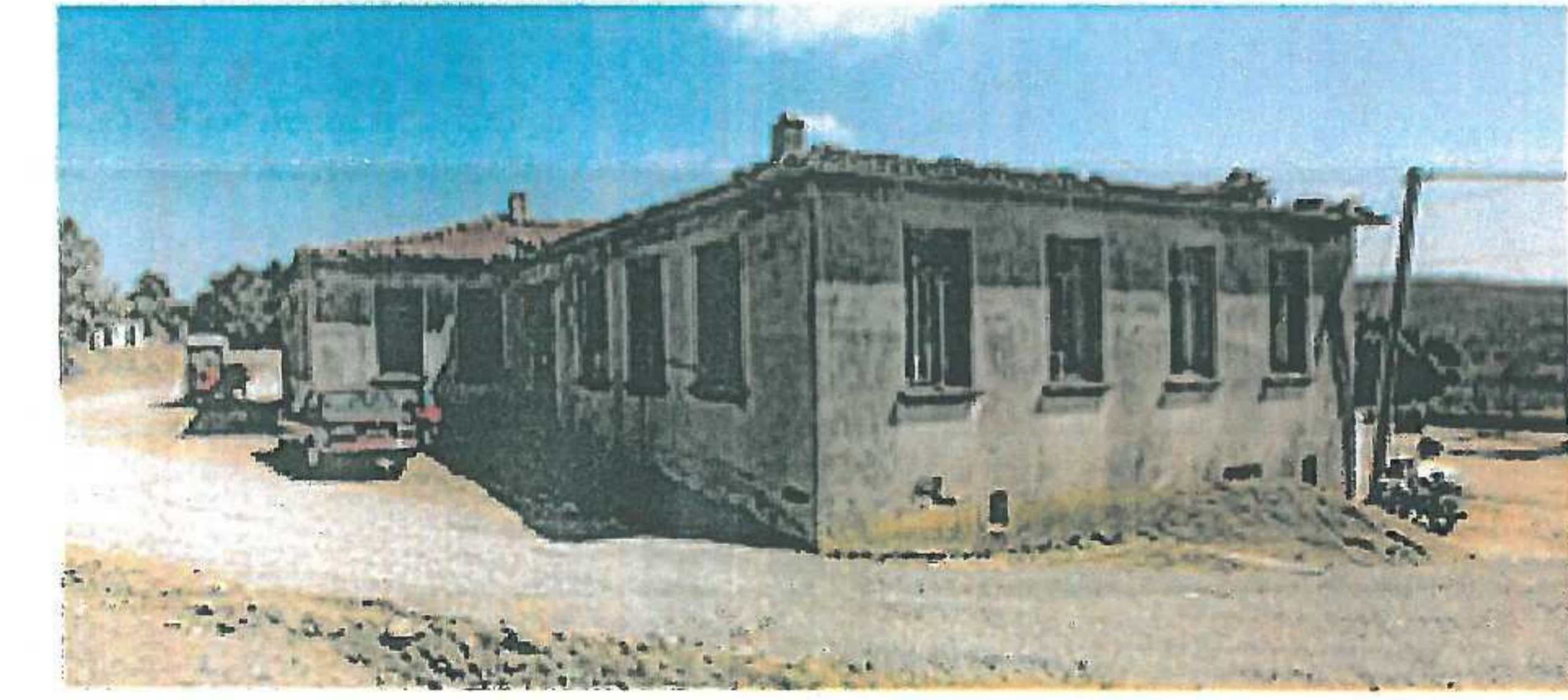
Sol Yan Cephe