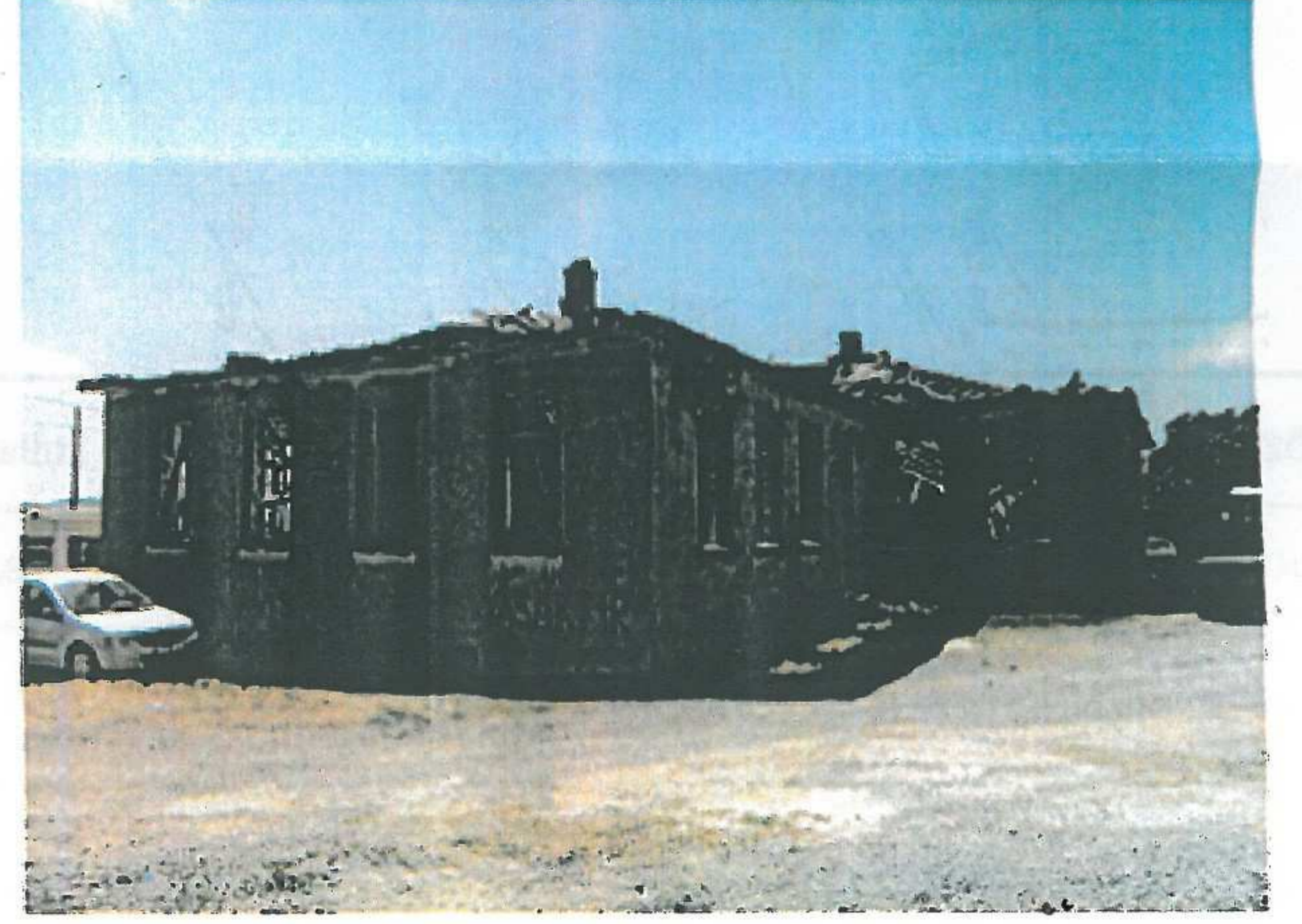
Sağ Yan Cephe