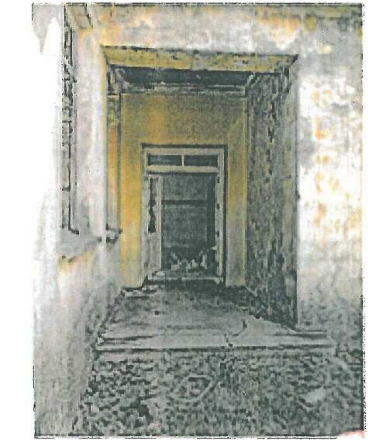
Arka Cephe Girişi