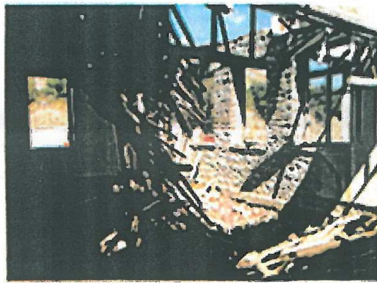
İç Mekanlardan Görüntüler