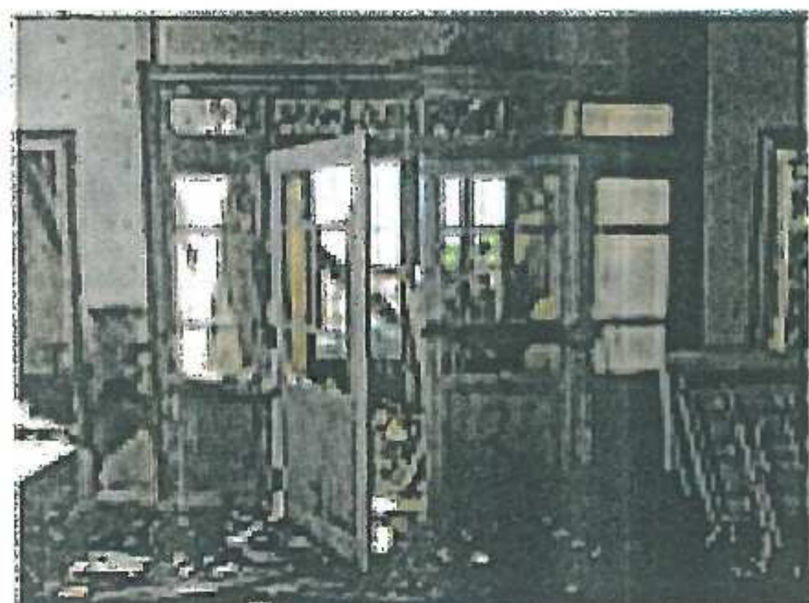
Ön Cephe girişine bakış