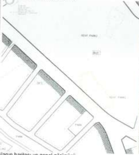
Alanın haritası ve genel görünüşü