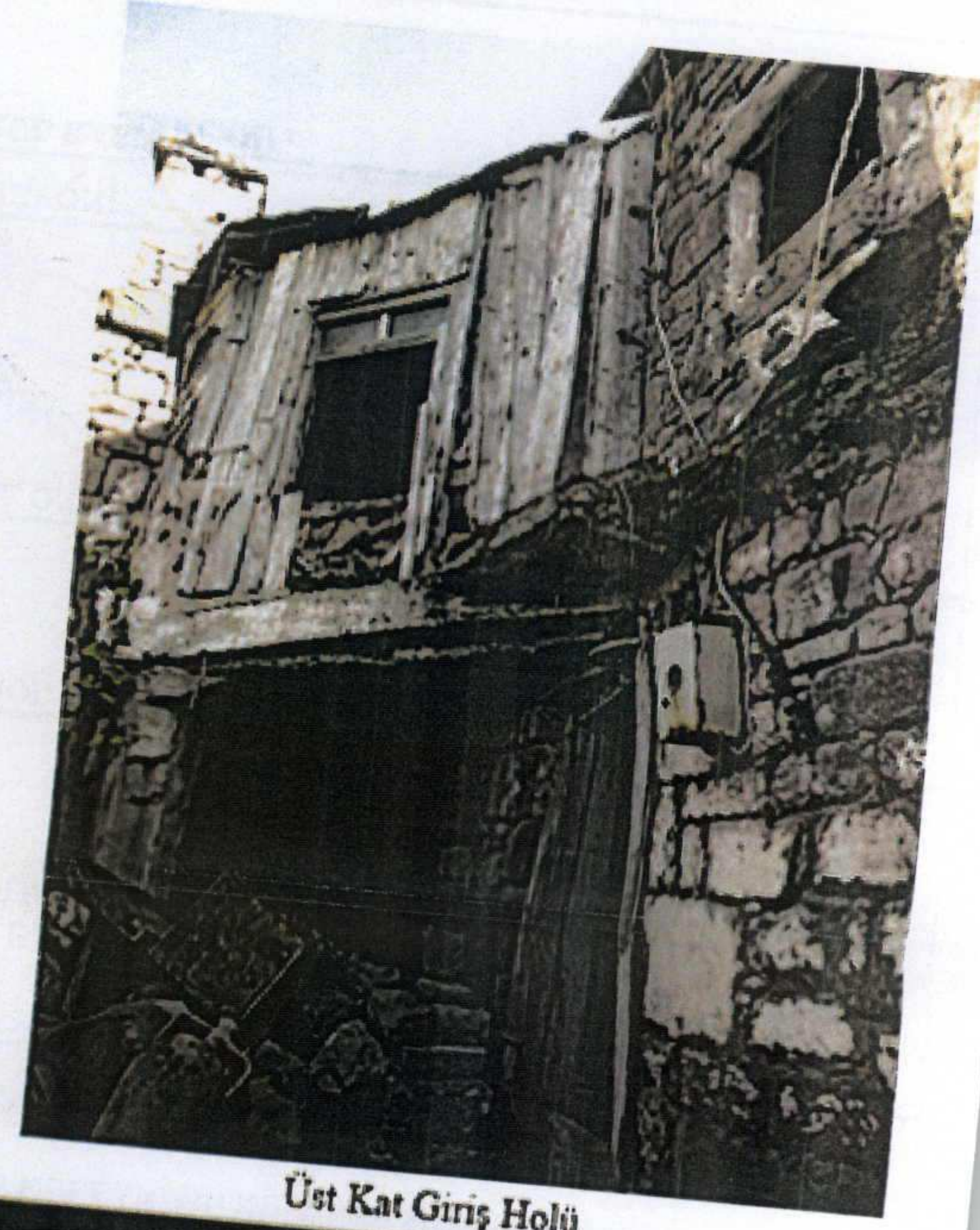
Üst Kat Giriş Holü