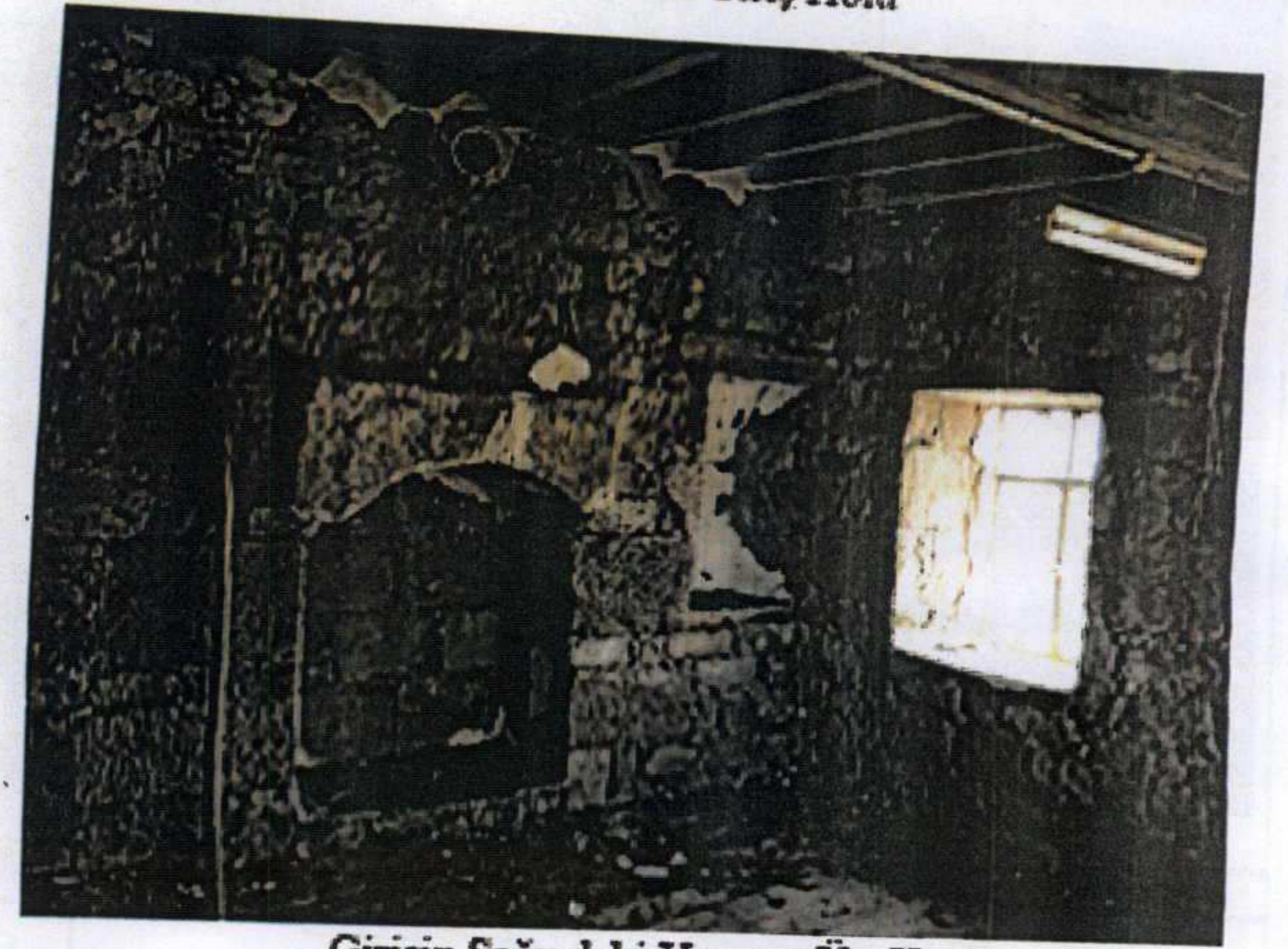
Girişin Sağındaki Yapının Üst Katı