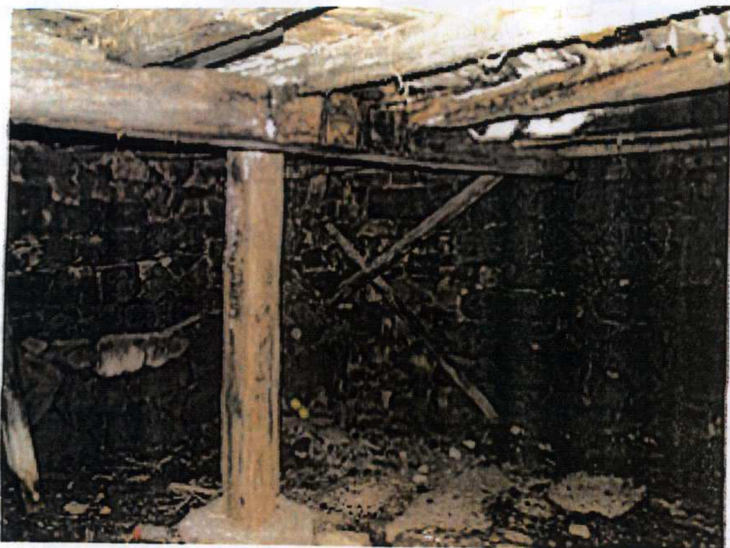
Zemin Kat - Depo