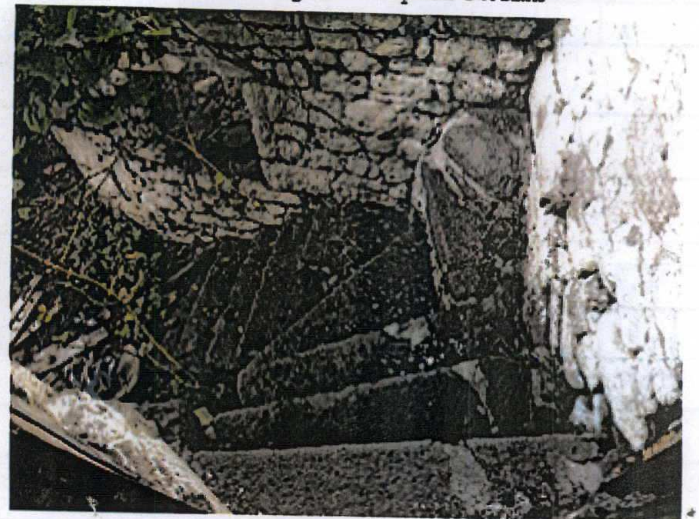
Üst Kata Çıkan Bahçe Merdiveni