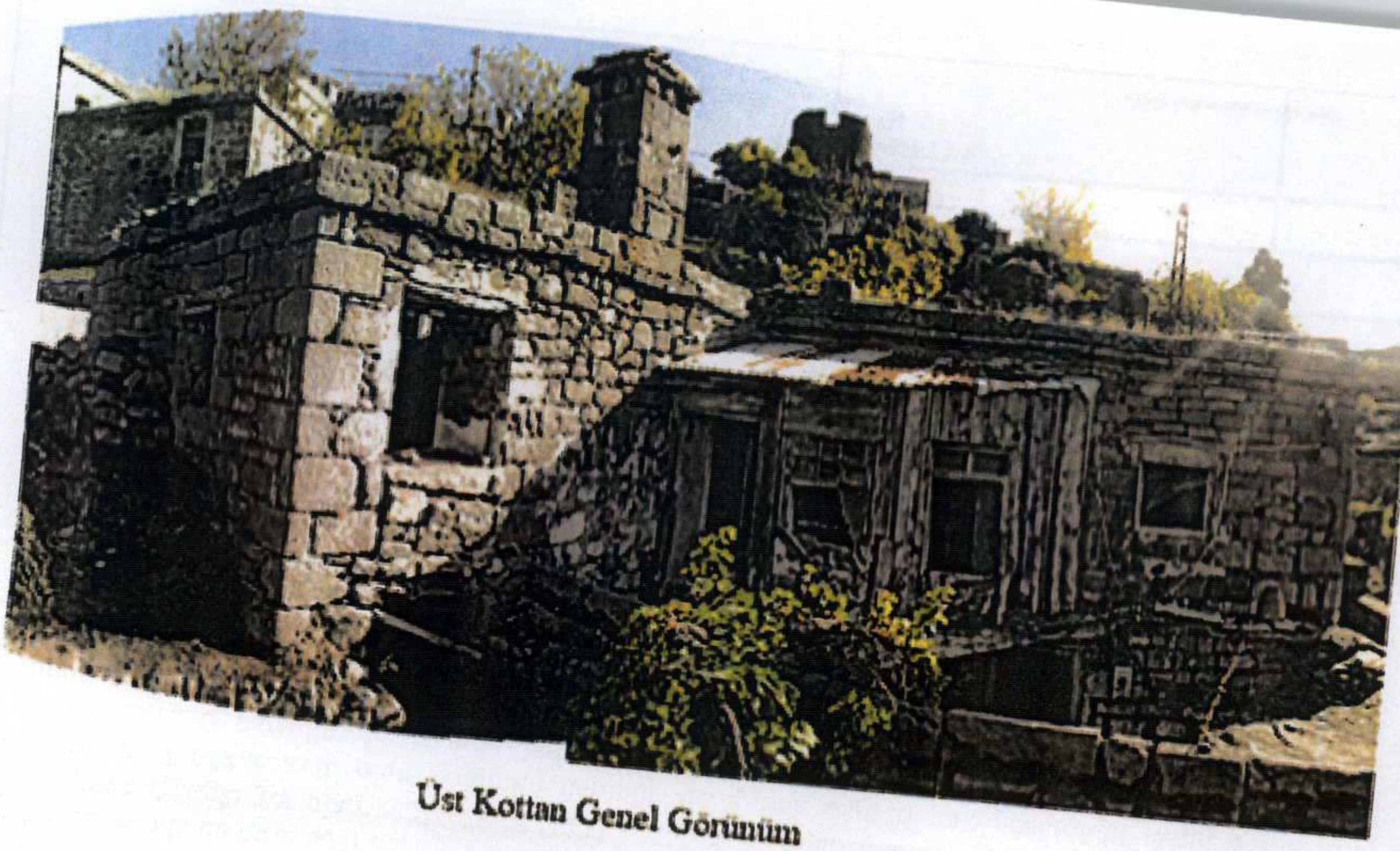
Üst Kottan Genel Görünüm