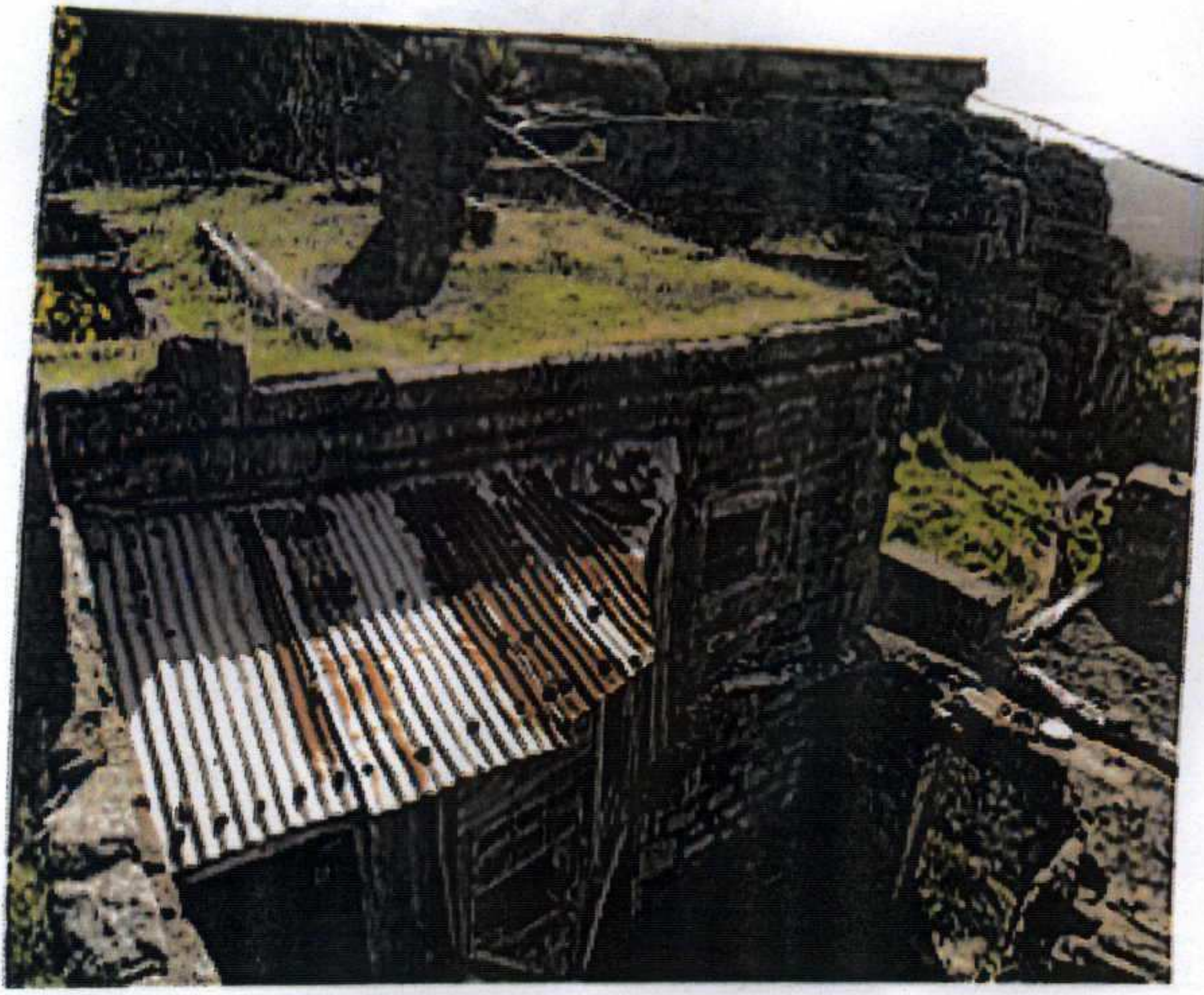
Üst Kottan Avluya Bakış