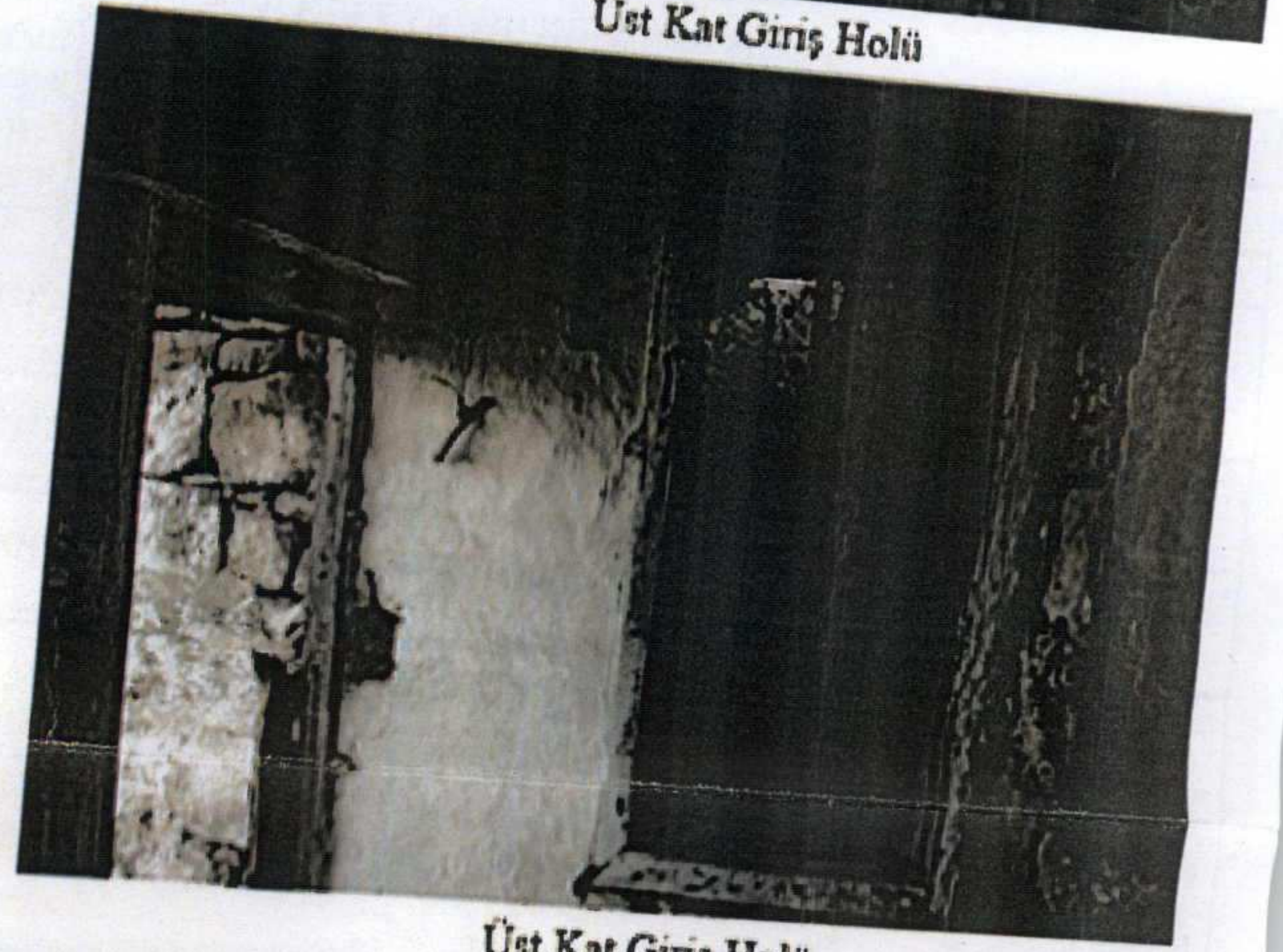
Üst Kat Giriş Holü