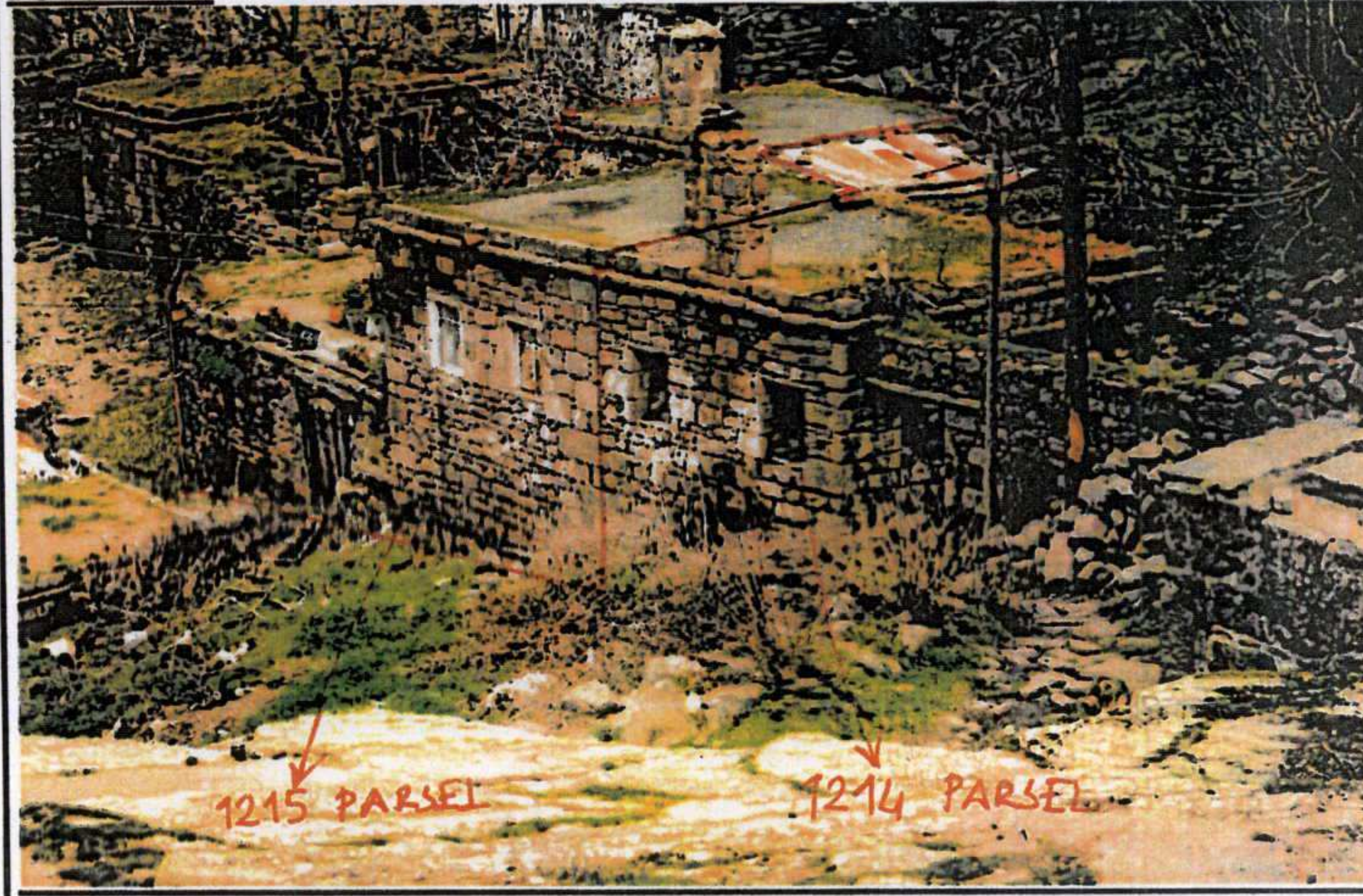
2003 Yılına Ait Fotoğraf

GÖZLEMLER: Kentsel Arkeolojik Sit Alanında kalan taşınmaz üzerinde, iç avluya bakan ikişer katlı iki adet yapı bulunmaktadır.