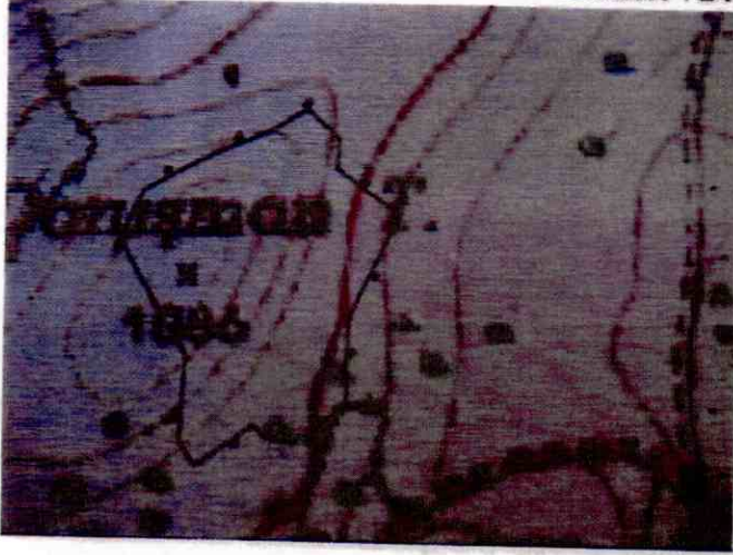
HARİTA VE FOTOĞRAFLAR: