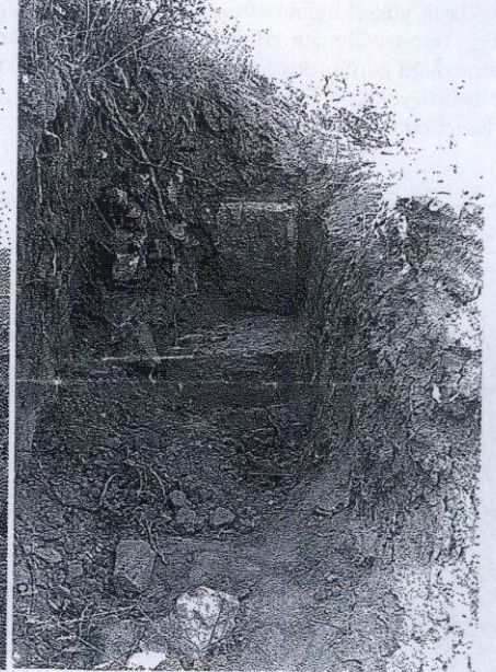
Tümülüs 1989 yılı görünümü ve kaçak kazılar sonucu açığa çıkan krepis duvarı

T.C. KÜLTÜR VE TURİZM BAKANLIĞI İzmir 2 Numaralı Kültür Varlıklarını Koruma Bölge Kurulu Müdürlüğü