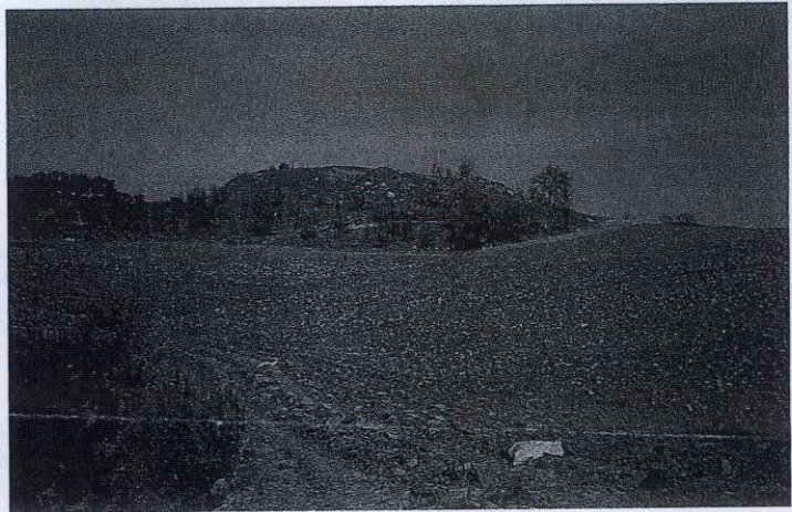
( Tümülüs 1989 Yılı Görünümü)