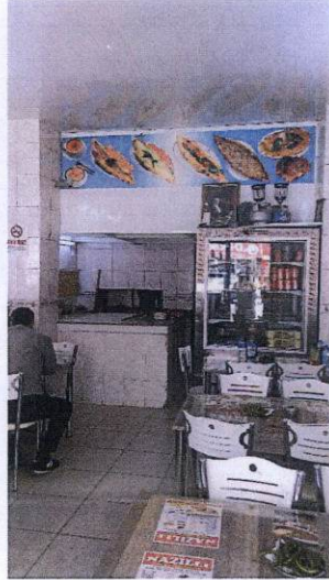
474 ada, 10 parsel