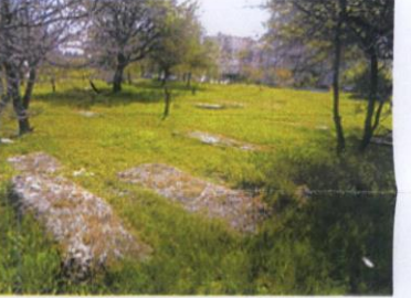
162 ADA, İMAR PLANINDA PARK OLARAK GÖSTERİLEN BÖLÜM