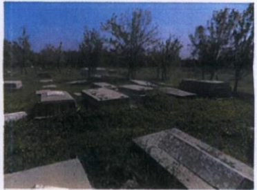
162 ADA, 379 PARSEL