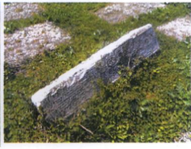
162 ADA, 377 PARSEL