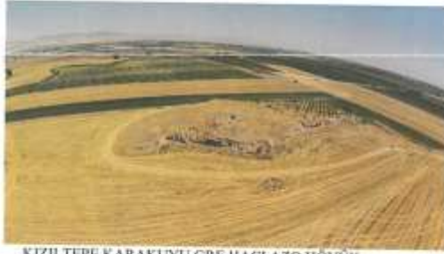
KIZILTEPE KARAKUYU GRE HACI AZO HÖYÜK