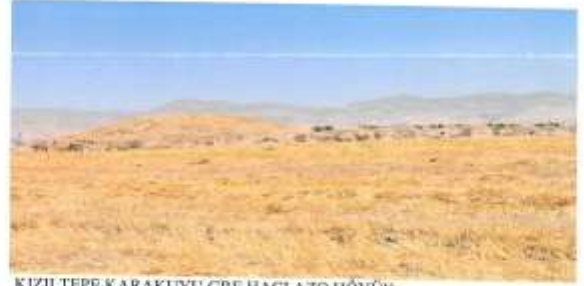
KIZILTEPE KARAKUYU GRE HACI AZO HÖYÜK