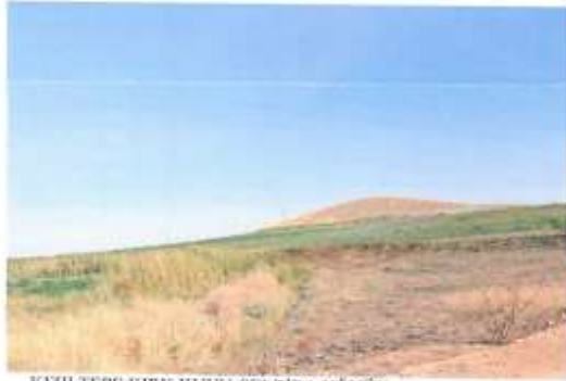
KIZILTEPE KIRK KUYU ÇELBİRA HÖYÜK