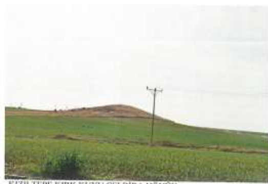
KIZILTEPE KIRK KUYU ÇELBİRA HÖYÜK