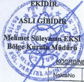
KOORDİNE ÖZET ÇİZELGESİ (İMAR/MEVZİ)

ESKİŞEHİR KÜLTÜR VARLIKLARINI KORUMA BÖLGE KURULUNUN 30.11.2017 TARİH, 5852 SAYILI KARARI EKİDİR.