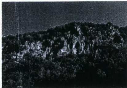
Tepenin genel görünümü