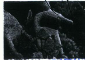
Ele geçen seramik örnekleri