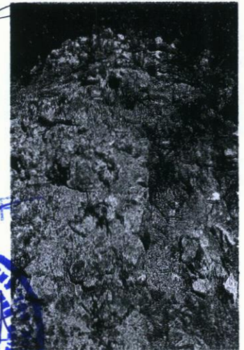
Duvar kalıntısından detay görünüm