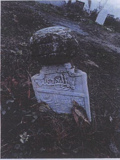
Huvel baki hicri- 1267 (miladi-1850)