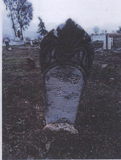
İl El- Mevt Ali Savran ruhuna fatiha hicri-1282 (miladi-1865)