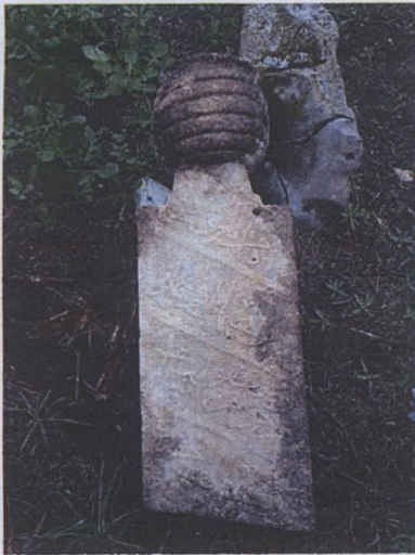
Dikdörtgen formlu kavuklu mezar taşı İl-el mevt burhan oğlu merhum ruhuna fatiha Hicri-1107 (miladi-1695)