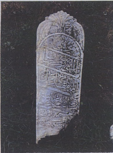
Dikdörtgen formlu duvaklı mezar taşı Hicri-1270 (miladi-1850)