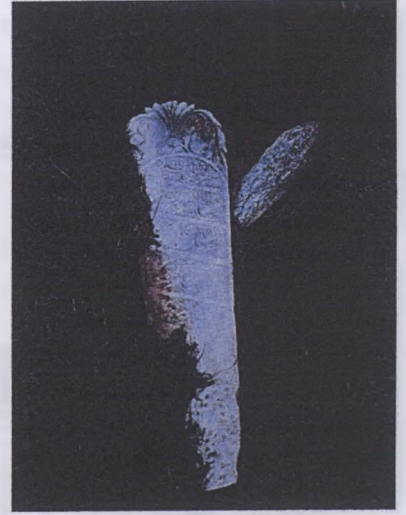
Huvel-baki hicri- 1271 (miladi-1854)