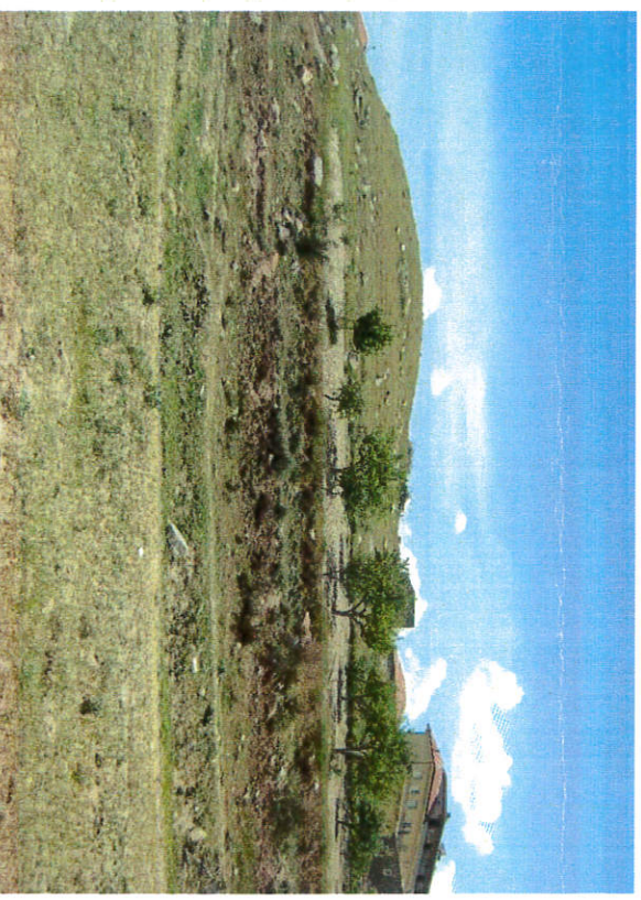
Höyüğün batıdan görünümü