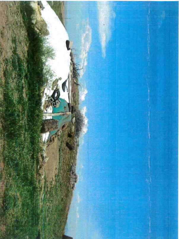
Höyüğün güneyden görünümü