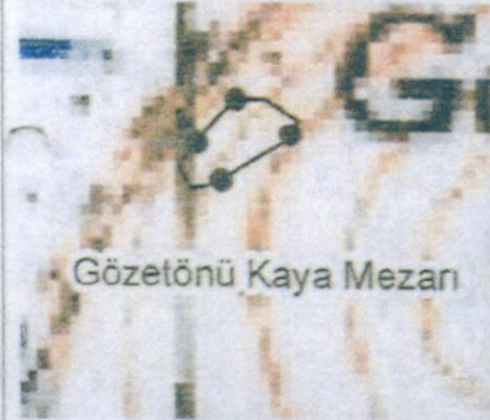
Gözetönü Kaya Mezarı