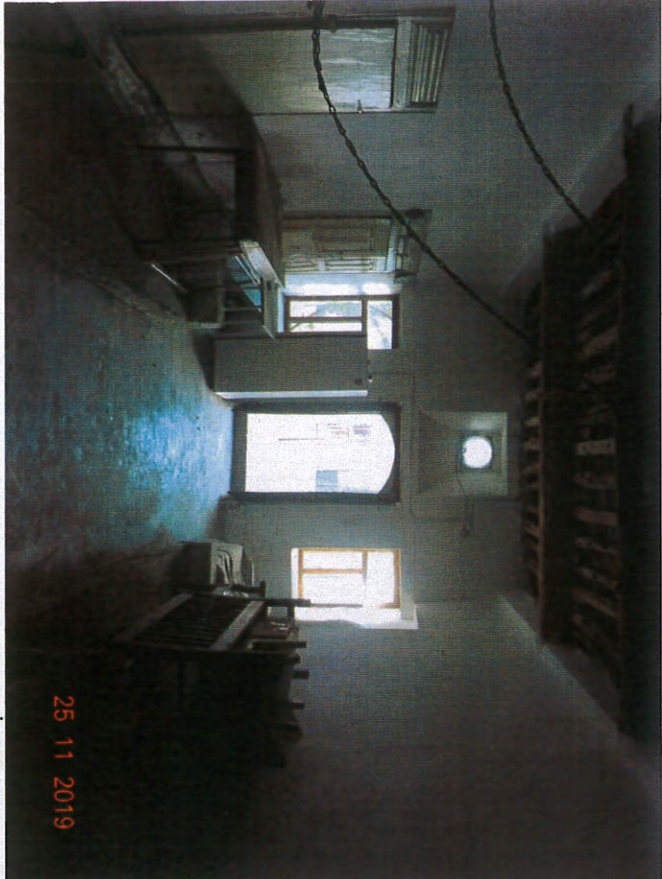
Taşınmazın Avlu Girişinin Karşısında Yer Alan Mekanın İçten Görünümü