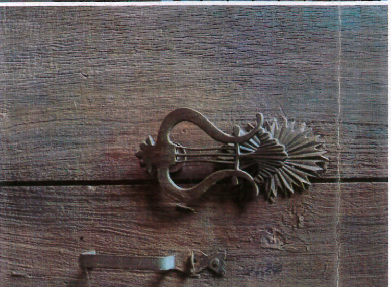
Kapı Tokamağı Detay