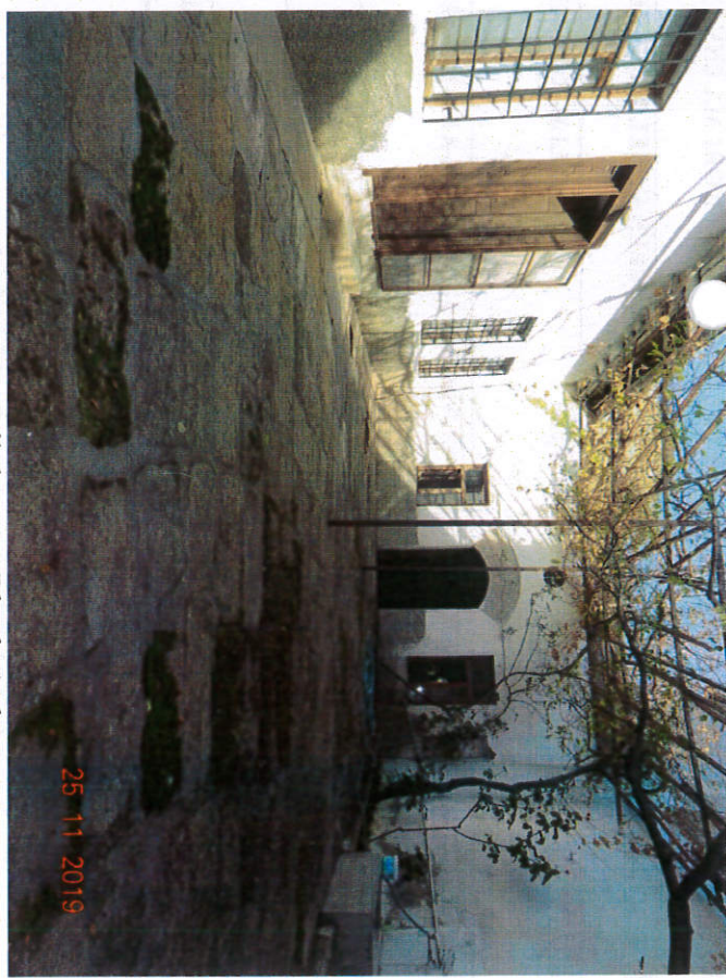
Taşınmazın Dikdörtgen Planlı Avlusu