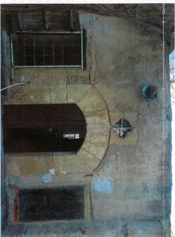
Basık Kemerli Bahçe Giriş Kapısı