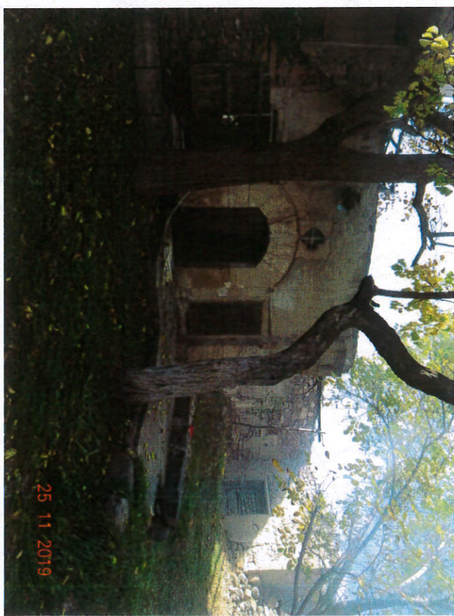
Avlunun Karşısında Yer Alan Mekanın Bahçeden Görünümü