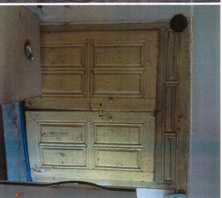
Ahşap Dolap Kapakları