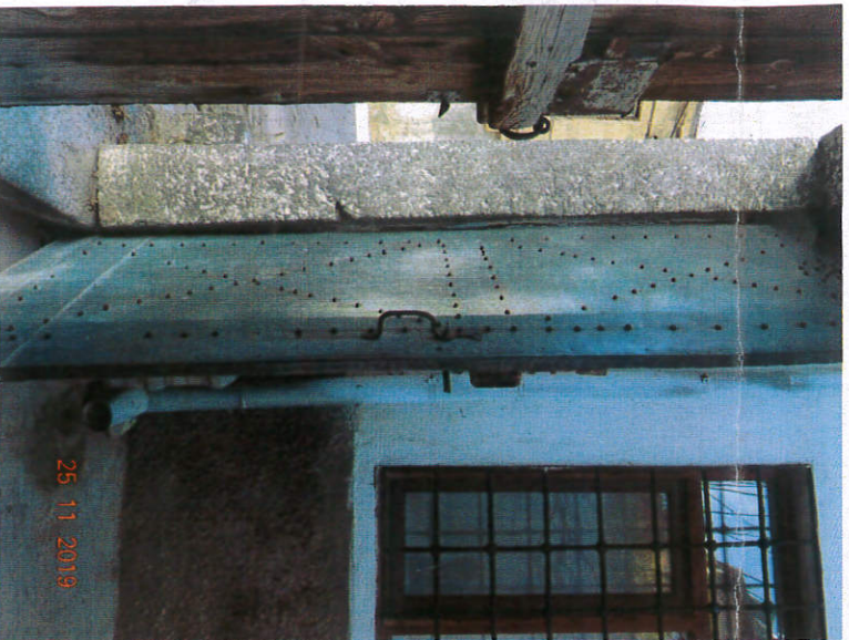
Avlu Giriş Kapısı