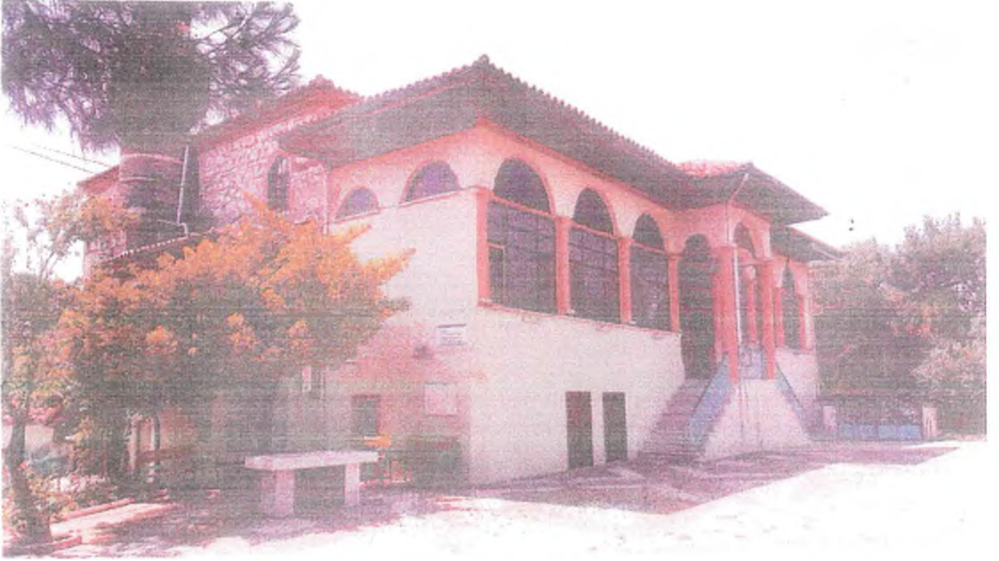
Kuzey-doğu cephesinden görüntüm