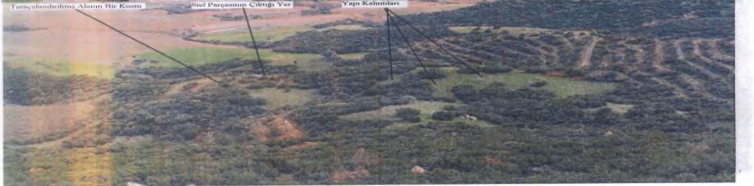
Tarıca bulundurulduğu Alanın Bir Kısmı