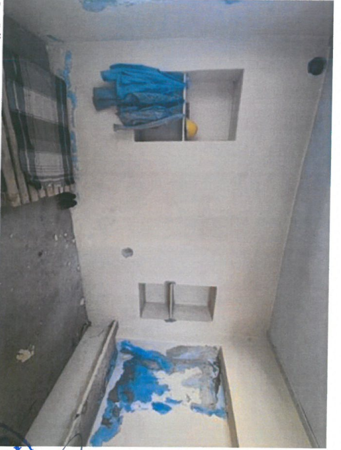
Avlu Güney Kanadındaki Odanın Doğu Duvar Sıva Raspası Görünüşü

Diğer Kültür Varlıklarını Koruma Bölge Kurulu Diyarbakır Kültür Varlıklarını Koruma Bölge Kurulu 21.09.2021 tarih ve 8619