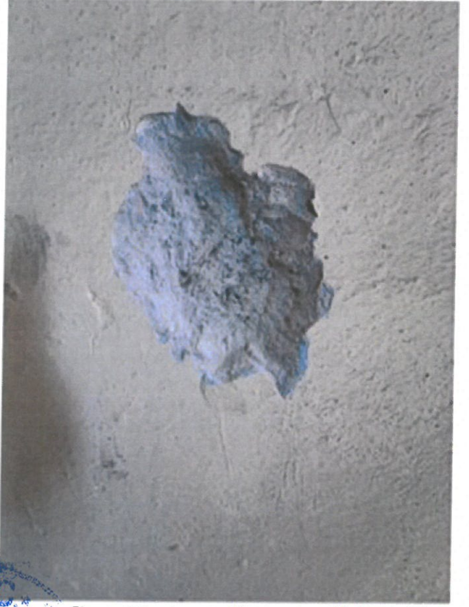
Duvar Sıva Raspası Sonrası Çıkan Baz:

T.C. Diyarbakır Kültür Varlıklarını Koruma Bölge Kurulunun Başkanı M. CAASLAN Müdür