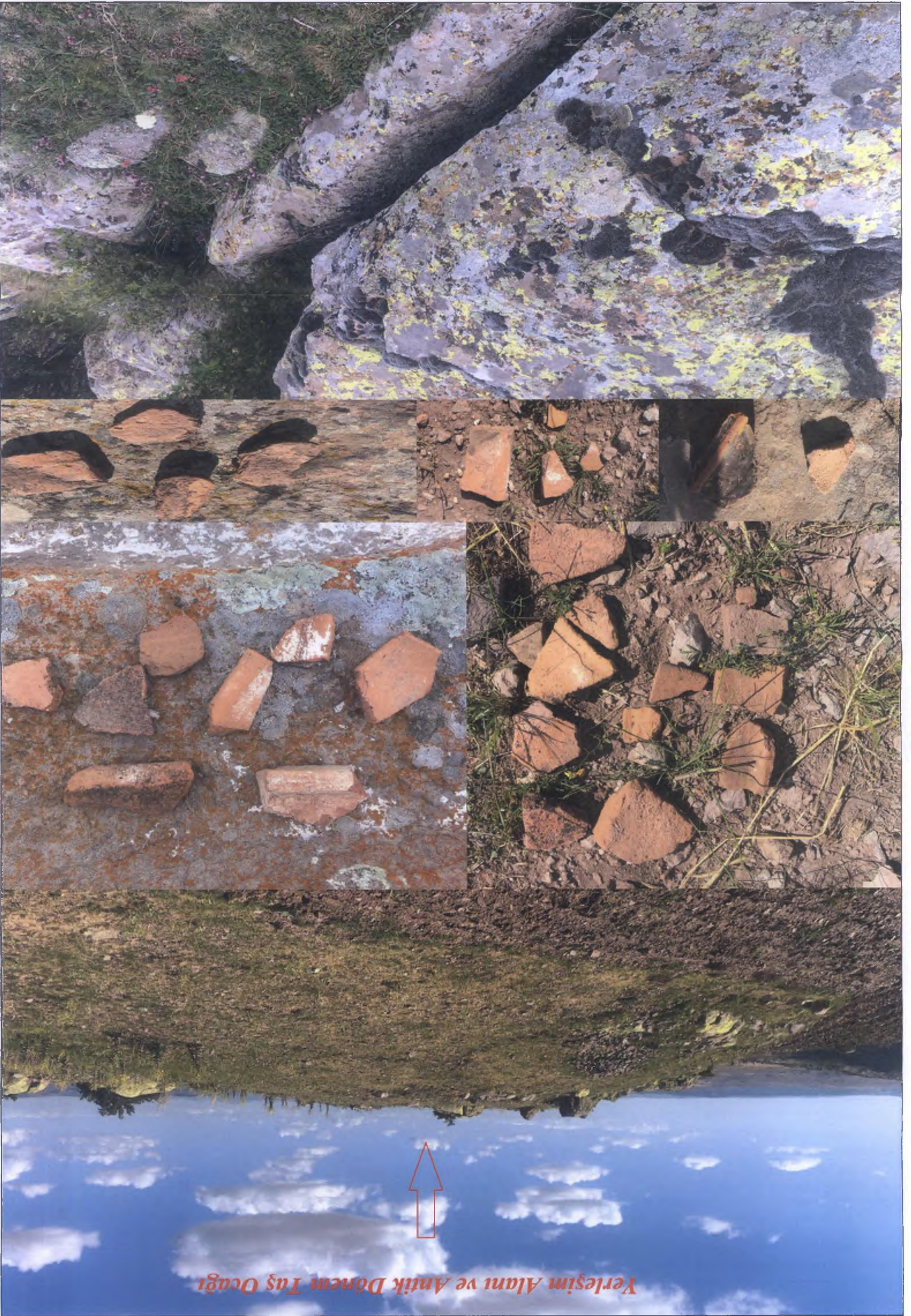
Verleşim Alanı ve Antik Dönem Taş Ocakları