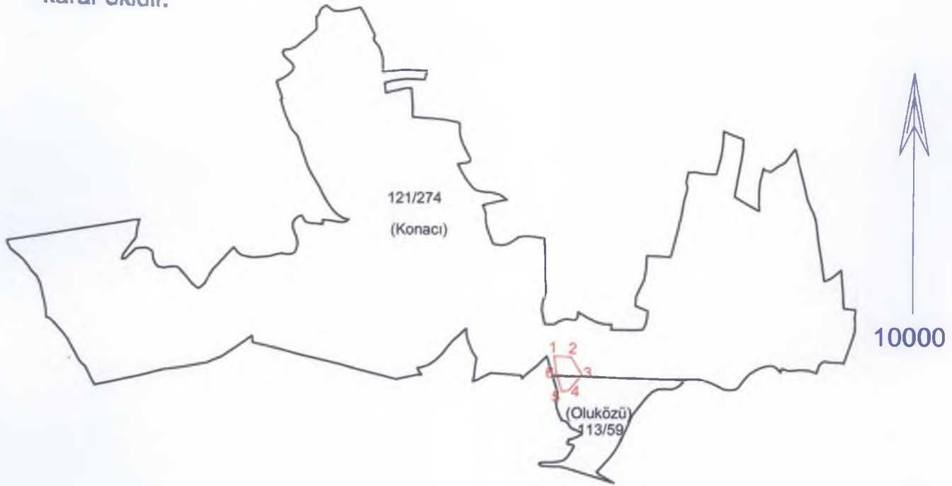
ITRF 3 Derecelik Koordinatlar

Kayseri Kültür Varlıklarının Koruma Bölge Kurulunun 23.10.2020 Gün ve 4798 Sayılı karar ekidir.