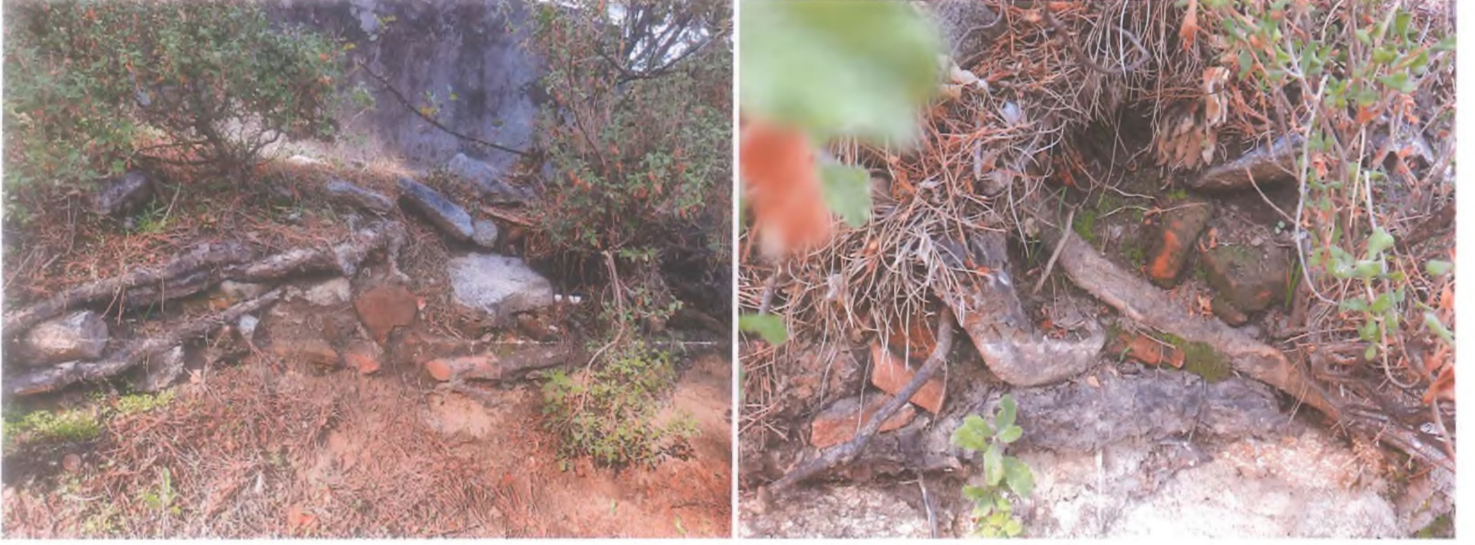
Arkeolojik buluntuların bulunduğu alandan görünümler

T.C. KÜLTÜR VE TURİZM BAKANLIĞI İzmir 2 Numaralı Kültür Varlıklarını Koruma Bölge Kurulu Müdürlüğü